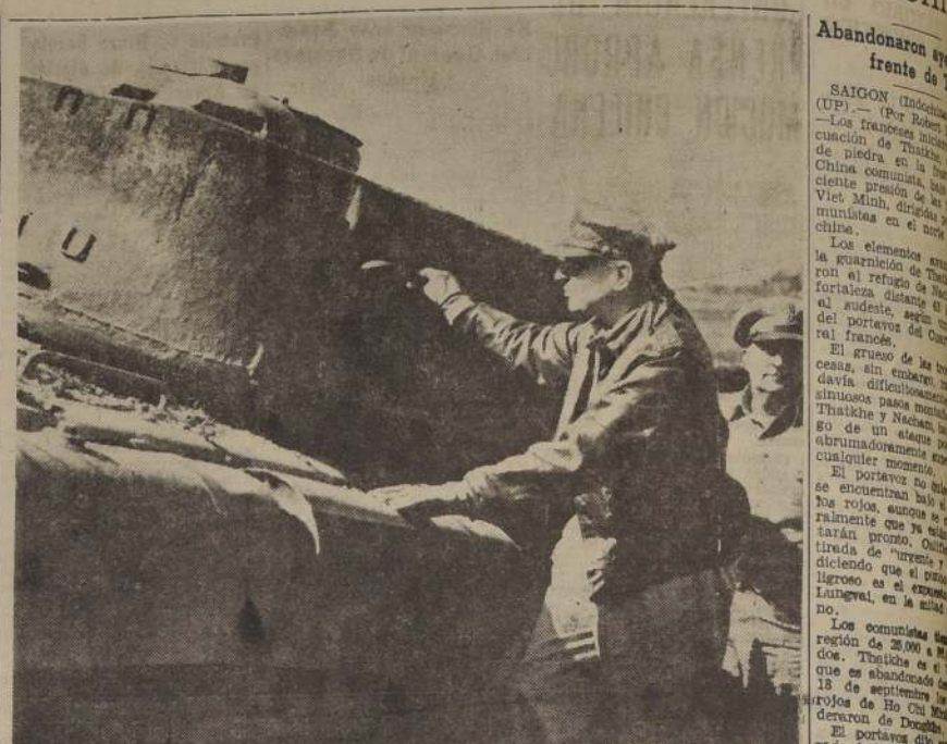
El general Douglas Mac Arthur, comandante general de las fuerzas unificadas de las Naciones Unidas, quien presta sus servicios en la República de Corea para repeler a los comunistas de Corea del Norte, inspecciona un tanque comunista destruido durante los recientes aterrizajes de las fuerzas de las Naciones Unidas en Inchon. El general Mac Arthur supervigiló y tomó parte en las operaciones de aterrizaje.

CRITICA SITUACION DE FRANCESES Q RETROCEDEN EN FRENTE DE INDOCHINA