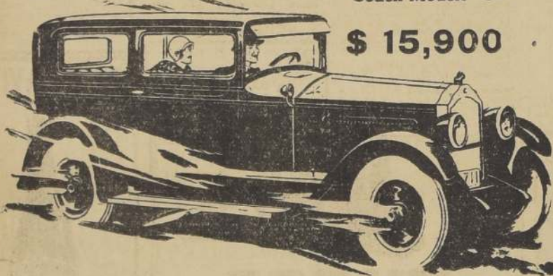
Coach Modelo “56”