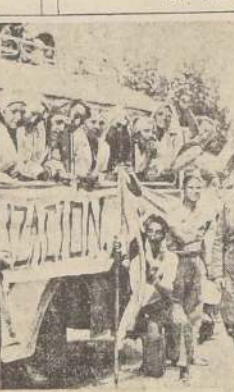
Milicianos fascistas parten para reunirse con sus compañeros en el frente