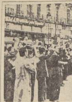
En la Puerta del Sol, de Madrid, a su paso hacia el frente del Guadarrama, un grupo de soldados responde al saludo antifascista

Hoy se reanuda la normalidad en la población, abriendo el comercio y los cafés.