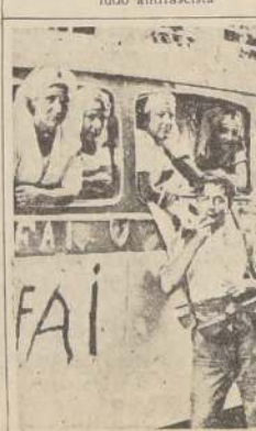
Un ómnibus requisado por la Federación Anarquista Ibérica y convertido en ambulancia de la Cruz Roja