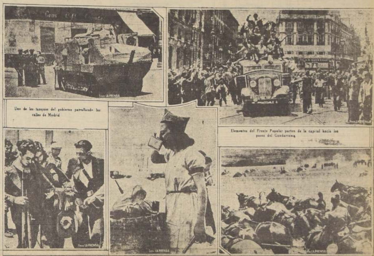
Una milicia herida en un combate es llevada a un hospital. La artillería rebelde hace fuego contra los leales de Guadarrama.