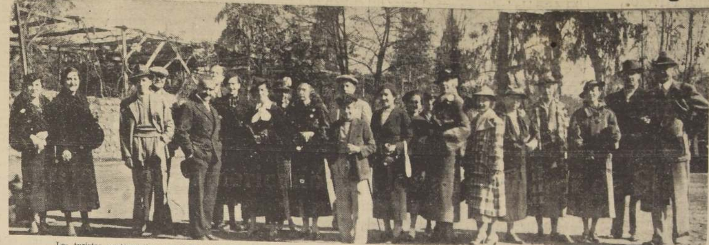
Los turistas norteamericanos que llegaron ayer en el Douglas "Santa Ana", después de un almuerzo que se les ofreció en una quinta de los alrededores