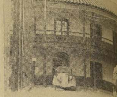
La ruinoso Municipalidad del moderno barrio de Providencia