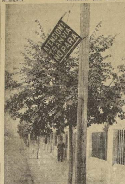
Este letrero que existe en General del Canto, parece haberse derribado temeroso del decreto N.º 13.

carros que se le formulaban de incumplimiento de disposiciones municipales.