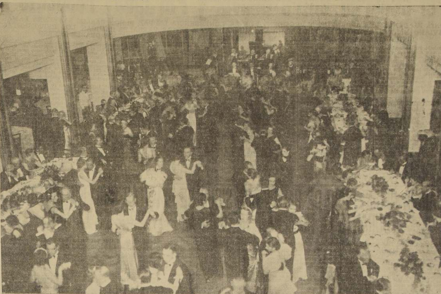
ASPECTO DEL CABARET DEL CASINO DE VIÑA DEL MAR, EN EL CUAL SE CONGREGAN SELECTOS GRUPOS DE LA SOCIEDAD DE VIÑA DEL MAR, VALPARAISO Y SANTIAGO