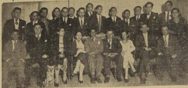
Asistentes a la manifestación ofrecida antenoche por el Consejo de la Asociación Deportiva de Providencia "Manuel Atria" al directorio, en su local social de Bilbao esquina de Manuel Infante.