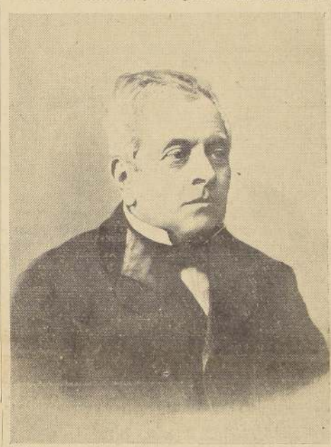
Don Manuel Montt

recer y fructificar en su decenio. Es un hecho reconocido por el propio Buines, y confirmado por Sarmiento y por toda la documentación privada de la época. El Presidente Buines dijo refiriéndose a Montt: "Este sujeto antes de conocerme, ya me había prestado servicios importantes; y poco después promovió y sostuvo mi candidatura, del modo entusiasta y eficaz que todos saben; me sirvió con lealtad y decisión cinco años consecutivos en el Ministerio y entonces y después no ha cesado de darme pruebas de amistad e interés, siendo mi principal recurso, mi consejero, y mi más activo cooperador en todas las crisis y dificultades de gravedad sobrevenidas durante mi administración".