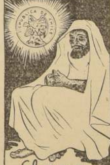
El oro y el moro

Las adhesiones se reciben en el Hotel Savoy.