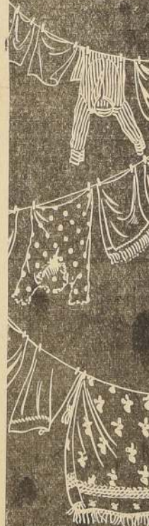
ABREVE EL LAVADO de SUS ROPAS usando GRINGO o GRINGUITO