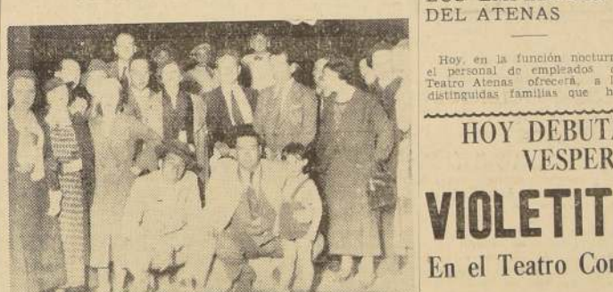
La Compañía Teatral Garcia Leon Perales, que llegó anoche a Santiago

YA ESTA EN SANTIAGO LA CIA. GARCIA LEON-PERALES