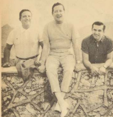
Los Panchos: una vez más vienen a mostrar su calidad

SI ESTE AÑO fue de los buenos en materia de visitas foráneas, al parecer, 1970, no se quedará atrás. Ya se anuncia, para el Festival de Viña del Mar, la presencia de Mercedes Sosa, Joan Manuel Serrat, Piero y muchas otras figuras internacionales, pero -al parecer- no todo quedará allí. "La Nación", en forma exclusiva, puede adelantar que para los días 2, 3, 4 y 5 de febrero del año que viene, está fijada la venida a Chile de un gran astro del disco: TRINI LOPEZ.