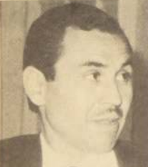
"Niego y rechazo cualquier insinuación que hubiéramos podido arreglar el partido con Antofagasta."