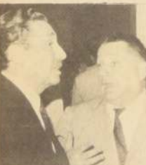
"Pidamos una terna de árbitros."