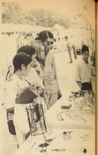
UN GRUPO de visitantes observa artesanías en metal.