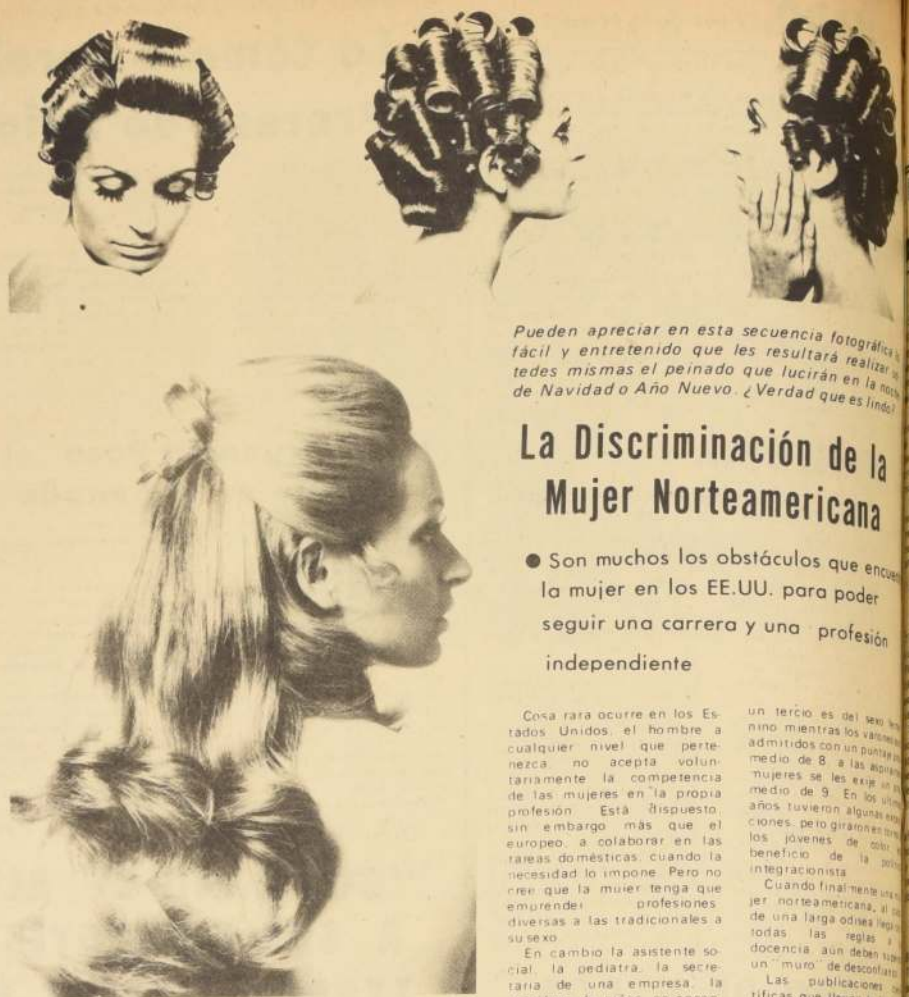
Pueden apreciar en esta secuencia fotográfica fácil y entretenida que les resultará realizar ustedes mismas el peinado que lucirán en la noche de Navidad o Año Nuevo. ¿Verdad que es lindo?

ENTRE LAS NUEVAS tendencias de la moda actual, se encuentra la de inspiración medieval, en la cual juegan un preponderante papel las amplias mangas, que recogidas al codo o en la muñeca producen un efecto abombado como lo muestra este modelo de Lanvin de señorial línea y original elegancia apropiada para clientas de gran vestir.