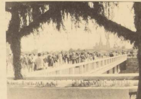
Amplios pasillos para peatones, una de las características del puente "Manuel Rodríguez".