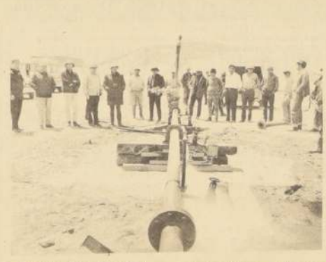
MOMENTO HISTORICO: Exactamente a las 16 horas del domingo 14 de diciembre surge el primer chorro de vapor geotérmico. Ingenieros, técnicos y camarógrafos de la TV nacional corren para captar en sus cámaras este emocionante instante.