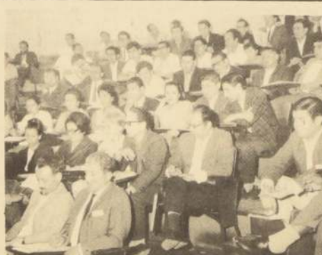
A salón lleno sesionan los miembros de la Asociación de Profesores y Empleados de la Universidad de Chile que celebran su Congreso que hoy clausuran.

Algunos de los asuntos a tratarse dentro del temario son: objetivos del Grado de