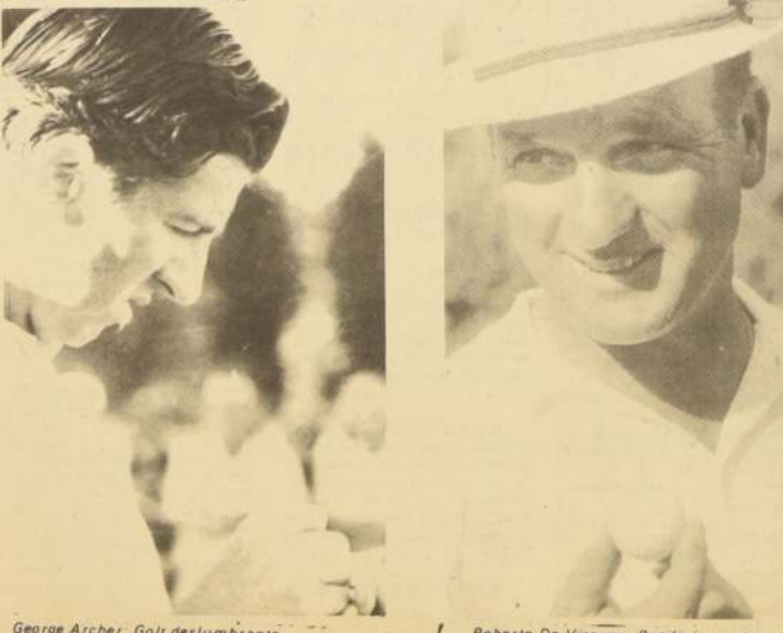
George Archer: Golf deslumbrante.

El elenco continental se apoyó como es lógico en el juego sólido y ponderado de Roberto de Vicenzo a quien acompañó decorosamente Francisco Cerda que estuvo lejos de reditar actuaciones y performances anteriores. No hay duda que el compromiso aplastó al player de Santo Domingo cuyo rendimiento en el green dejó mucho que desear. No obstante, tres mejores pelotas fueron suyas en el match. Fue ese su aporte.