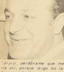
"Jiji, perdóneme que me ria así, porque tengo los labios partidos."