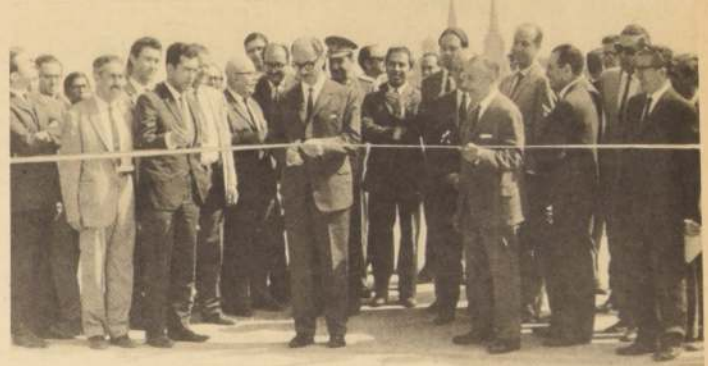
El Ministro Celedón corta la cinta al inaugurar el nuevo puente.

Finalmente la comitiva visitó el puente sobre la Avenida Isabel Riquelme.