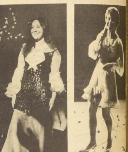
Gloria Benavides, la más popular cantante de 1969