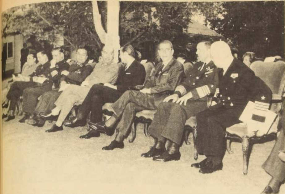
Nueve oficiales de la Fuerza Aérea de Chile recibieron ayer sus diplomas de graduación que les otorga el título de Especialistas en Estado Mayor. La ceremonia se realizó en la Academia de Guerra Aérea y contó con la presencia del Presidente de la República, Eduardo Frei, los Comandantes en