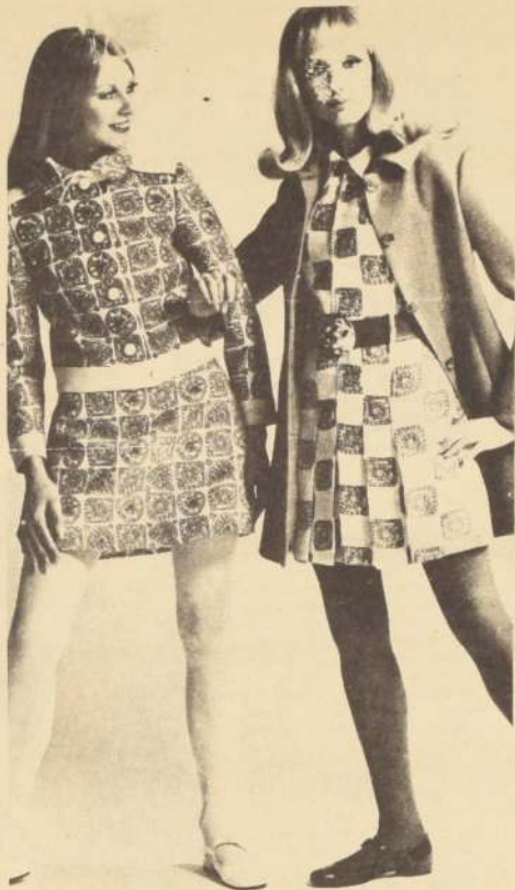
ESTOS DOS JUVENILES vestidos, diseñados por Louis Feraud, muestran otra de las tónicas de las últimas colecciones parisinas: los estampados geométricos.

ENTRE LAS NUEVAS tendencias de la moda actual, se encuentra la de inspiración medieval, en la cual juegan un preponderante papel las amplias mangas, que recogidas al codo o en la muñeca producen un efecto abombado como lo muestra este modelo de Lanvin de señorial línea y original elegancia apropiada para clientas de gran vestir.