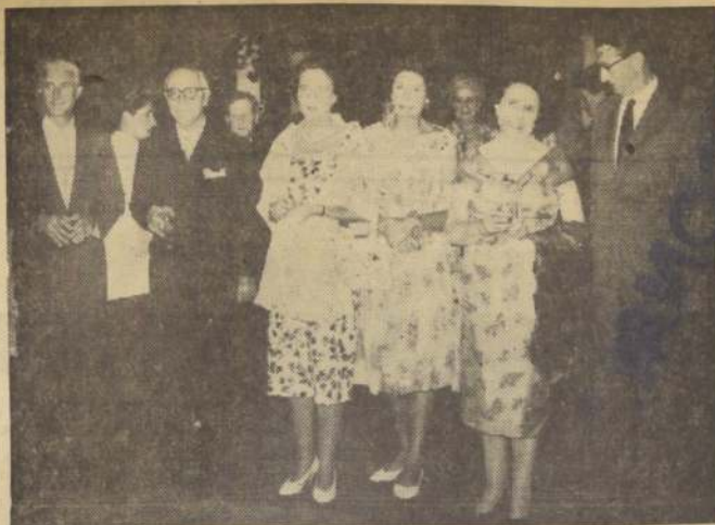
Con motivo de la finalización del año escolar, los rectores de colegios británicos en Chile fueron agraciados con un pastel en la casa del Agregado Cultural de la Embajada, Robin Duke. Asistieron el Embajador, Ivor Pink; el Ministro de Educación, Eduardo Moore, y miembros del Consejo Británico. En el grabado, el Embajador, el Ministro Moore, las esposas de Pink, Duke y Moore y el Agregado Cultural.

AGUA POTABLE DE PARRAL Llámanse a propuestas públicas para la ejecución de las obras de terminación y habilitación de dos sondajes en Parral, con un presupuesto oficial aproximado de $ 16.400. Se entregarán antecedentes a los interesados del 7 al 10 de enero, inclusive, y las propuestas se abrirán el 16 del presente, a las 11 horas.