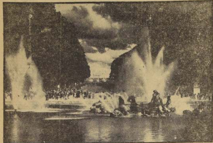
Juegos de agua —una encantadora alianza de música, danza y pirotección— en la Fuente de Neptuno, de los jardines del Palacio de Versalles, en París.