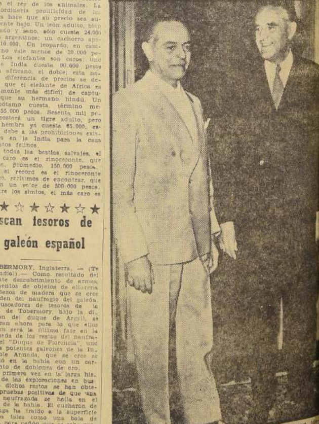
ROMA.— El Gobernador de Nueva York, Averell Harriman, durante su reciente visita a la capital de Italia, departió cordialmente con el Ministro de Relaciones Exteriores, Gaetano Martino. El nombre de Harriman —que fue Embajador entre los EE. UU. en Londres y en Moscú— se ha mencionado entre los posibles precandidatos del Partido Democrático a la Presidencia de USA, en las elecciones de 1956. Todo depende, sin duda, de que Stevenson quiera cederle el paso y, una vez proclamado, que Eisenhower no decida postular a su reelección. (PUBLIFOTO).

Por primera vez en la larga historia de las explosiones en busca de dichos restos se han obtenido pruebas positivas de que una balsa neutra de se halla en el fondo de la bahía. El cuñador de la draga ha traído a la superficie objetos tales como una bola de piedra para cañón que se sabe pertenece al período de la Armada, una especie de acero todólogo, una funda de una daga española de 35 cm. de longitud, para vino, dos ruedas de cañón, cientos de bloques de madera, de roble africano y pedruzcos de granito procedentes de Cerdeña, los cuales se utilizaban como lastre en los buques de la Armada.