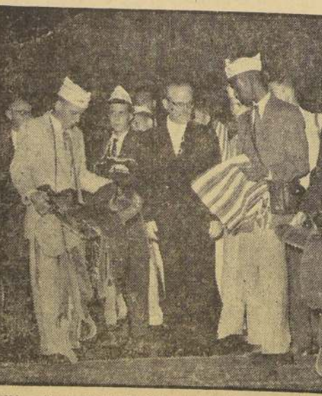
ROMA.— En el Palacio del Quirinal, el Presidente de Italia, Giovanni Gronchi, recibió la democrática visita de un grupo de alumnos-periodistas del Oeste de los Estados Unidos de Norteamérica. Estos no sólo lo reportearon, sino que le obsequiaron, para sus niños, —que como los niños del mundo sueñan con los cow-boys—, dos artísticas sillas de montar hechas a propósito en Texas. (PUBLIFOTO).

AGOSTO 26 1549.—Nueva fundación de La Serena. 1767.—Los jesuitas son expulsados de Chile y demás dominios de España. 1769.—Parte de Plymouth el explorador y marino británico James Cook. 1885.—Se crea la provincia de Curicó. 1920.—Se dicta la Ley de Instrucción Primaria Obligatoria.