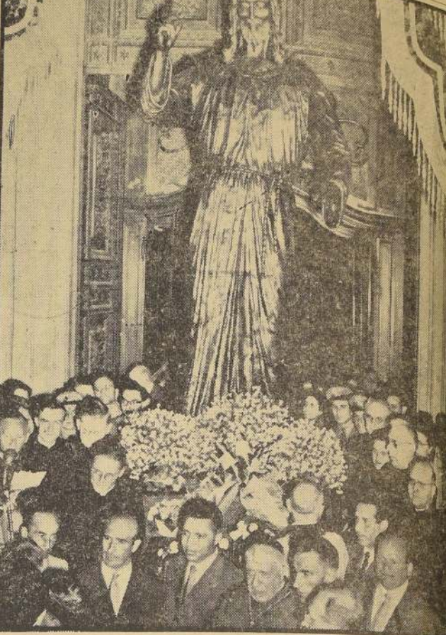
TURIN.— He aquí la estatua del "Cristo de las Cumbres", que los alpinos transportarán, durante el presente mes de agosto, a la cima del Monte Rosa, desde donde la figura del Redentor bendecida por Su Eminencia el Cardenal Fossati, de Turin, que aparece en el centro de la foto del primer plano. (PUBLIFOTO).

SUCESOR DE CHAPLIN.— La entrada de Cantinflas en el mercado cinematográfico mundial ha sido ya anunciada por expertos en el arte como un acontecimiento de primera magnitud. Un director de la compañía de Michael Todd manifestará en Londres, que todo el mundo en la industria del espectáculo le aprecia su extraordinario talento y reconoce que, dada su relativa juventud, es capaz de ocupar el puesto que dejó Charlie Chaplin en las comedias cinematográficas.