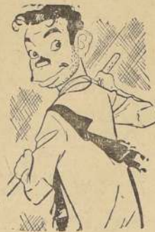
CANTINFILAS (Mario Moreno).

El número de la licencia del automóvil Cadillac, de Cantinflas, es el 777777. En Acapulco su número de teléfono es el 777. La licencia de su jancha a motor, es la 777... ¿Sorprende que tenga tanta suerte?