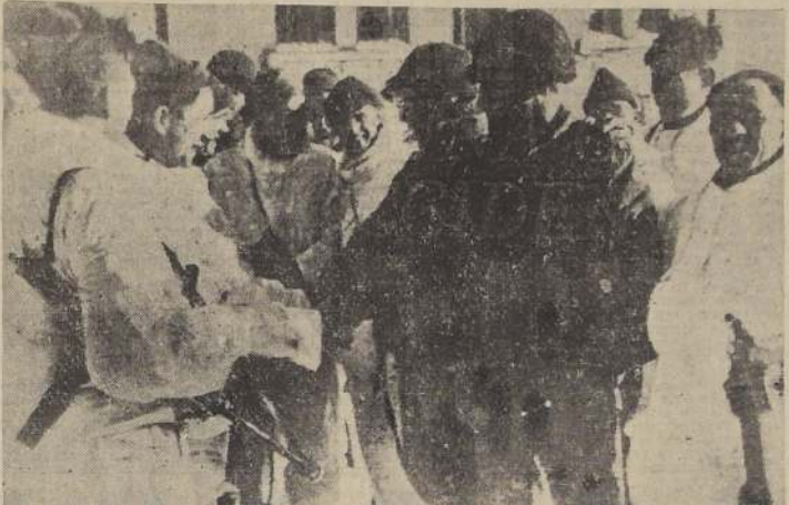
Los británicos (en uniformes blancos para camuflaje) y patrullas americanas se reúnen en Champon, en las Ardenas.

Esta maniobra específica se ha considerado como un posible nuevo intento para desequilibrar el frente occidental, y es allí donde únicamente retienen los nazis la iniciativa. Tras un avance de industrial de la Alta Silesia, po