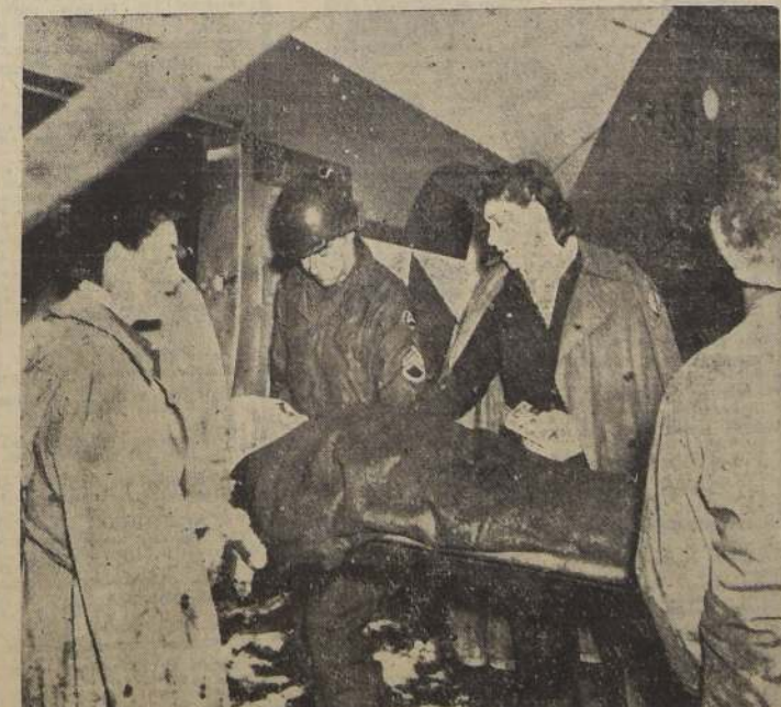
Enfermeras y miembros de la Cruz Roja Norteamericana llevan a un soldado herido en el frente occidental por vía aérea a Inglaterra. Desde la invasión anglo-americana al continente europeo, por vía aérea se han transportado más de cien mil heridos desde las zonas de combate.

"VARSOVIA NO ES AHORA MAS QUE UN MONTON DE RUINAS"