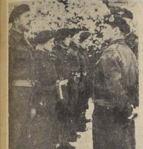
El Mariscal de Campo Montgomery, recientemente nombrado Comandante en Jefe del Ejército Aliado, pasando revista a las tropas de la Sexta División, que han mantenido un sector de la línea contra el saliente alemán.

EJERCITOS ALIADOS PREPARAN UNA GRAN EMBESTIDA EN EL FRENTE OCCIDENTAL