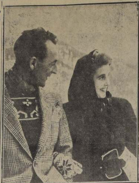
St. MORITZ, Suiza. — Bárbara Hutton, la famosa "heredera" norteamericana, acaba de contraer matrimonio, por cuarta vez, con el príncipe ruso Igor Troubetzkoy, con quien se la ve en la foto. Este ha sido el primer matrimonio del príncipe. El marido anterior de Bárbara Hutton era el actor cinematográfico Gary Grant.

WASHINGTON, 26 (U. P.).— Truman se mostró preocupado respecto a los precios elevados, y exhortó a las industrias a reducir los precios siempre que fuera posible. Manifestó la esperanza de que los precios no siguieran subiendo, para que no fuera a producirse un serio movimiento inflacionario. Añadió que esperaba que el mundo de los negocios se diera cuenta de la inscripcón en el muro, para que dicho movimiento no se produjera. Señaló que algunas grandes industrias ya han reducido los precios de sus productos, y expresó la esperanza de que otras hicieran lo mismo.