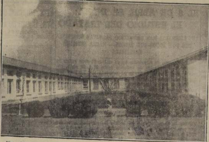
Vista del patio central del establecimiento con una parte de los pabellones para enfermos

La atención del sitio en que está ubicado fue resuelta, en primer lugar, por su cercanía a