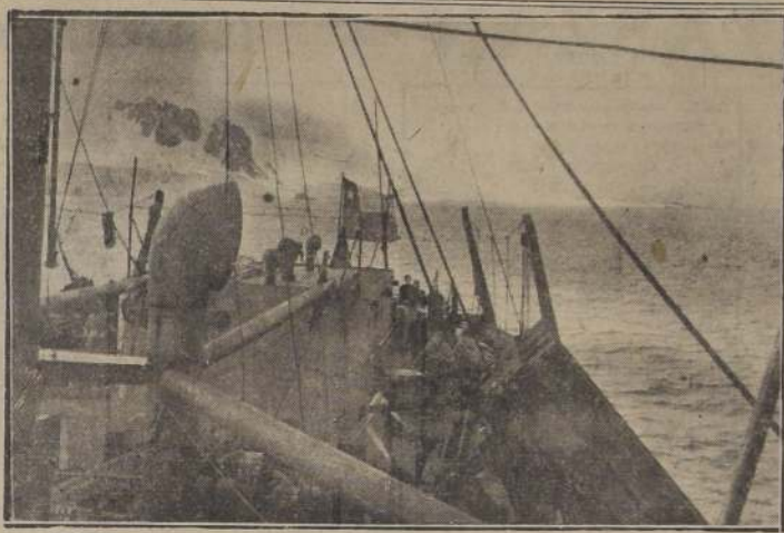
El transporte "Angamos" durante su travesía del Océano Glacial Antártico