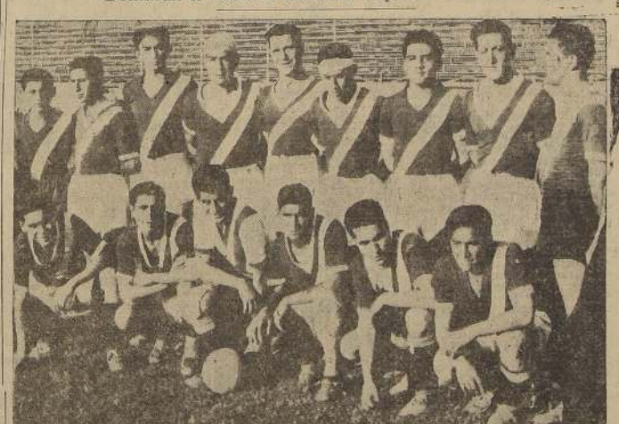
Equipo del Carlos Vial, que empató a un tanto con Metropol.

Definirán el título de campeón el próximo sábado