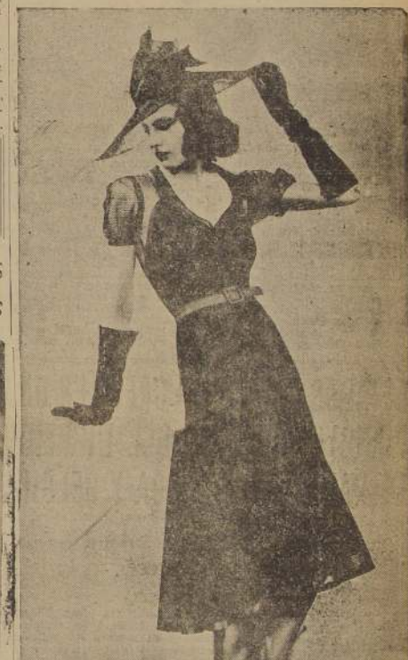
Vestido en tul de redécilla grande, en azul vivo. Sobre él se incrustan lazos de color azul marino. Sombrero haciendo juego, en tul y tafetán. Creaciones de Paquin.