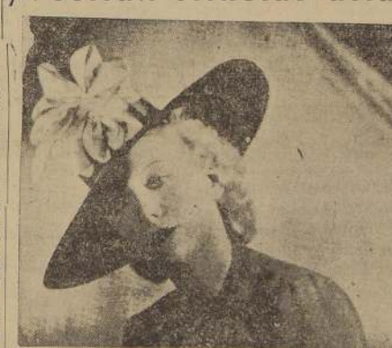
Gran capelina de paja negra trabajada en laminillas, y adornada con un gran lazo de falla asargada de color rosado.

Los sombreros grandes precisan siluetas altas