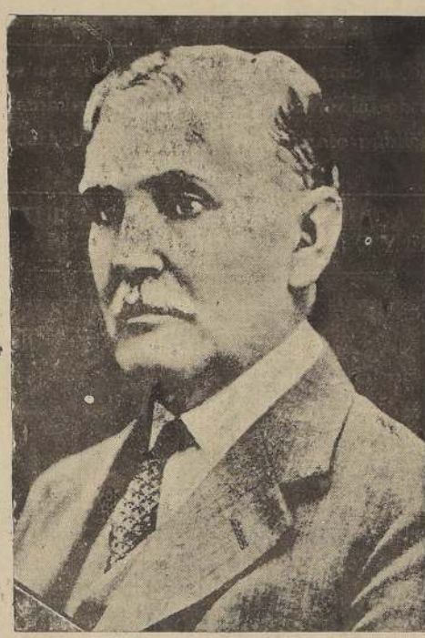
Excelentísimo señor Ramón S. Castillo, Vicepresidente de Argentina

—No estima S. E. que las manifestaciones de solidaridad continental no sólo deberán de expresarse en el sentido de cooperación espiritual y de defensa de los principios democráticos, sino que deberán penetrar también en el campo de una estrecha convivencia material procurando una amplia colaboración a fin de mejorar las condiciones de vida de los habitantes?— Insinuamos.