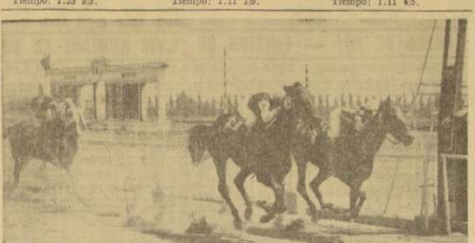
Bonita llegada animaron Harbin y Le Gironde. En la meta, el hijo de Holmbush, sacó una nariz a su favor. Tercero, a 2 1/2 cuerpos, remató Bob.