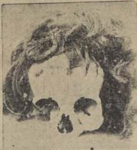
La cabellera rubia adherida a una calavera

Monckeberg, ha puesto en juego, por su parte, todo su interés y actividad para realizar en la mejor forma la resolución de la autoridad local. En efecto, según informaciones que pudimos obtener, hará estudiar las construcciones que forman la plaza del Cementerio General, con el mismo estuco que tiene en la actualidad su frente.