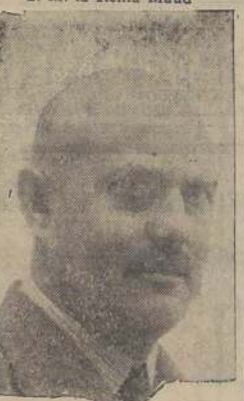
S. M. el Principe Olaf, heredero del trono noruego

fabricación de cerveza. De nuestros productos minerales, año tras año.