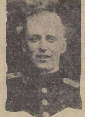
S. A. R. el Principe Olaf, heredero del trono noruego

artículos de gran importancia, como el papel, el carburo de calcio, explosivos y el pescado en conserva. Nuestro país exporta para el mercado noruego productos agrícolas, como la cebada para la