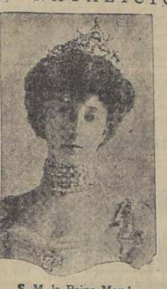
S. M. la Reina Maud

Noruega, en relación con sus habitantes, tiene un comercio considerable en el extranjero. Su marina mercante figura entre las primeras del mundo, pues sólo la superan en tonelaje las de Inglaterra, Alemania y Estados Unidos. Chile importa de este país