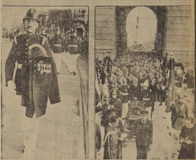
El Ministro del Interior, el Alcalde de Santiago, dirigentes del Cuerpo de Bomberos y otras personalidades, esperan en la puerta de la Necrópolis la llegada de los restos.—Un oficial de la 5.ª Compañía, porta el casco y el uniforme cubierto de condecoraciones del que fuera el primer bombero de Chile.—Instante en que la urna entra al Cementerio General.