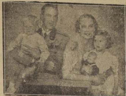
El rey Humberto II de Italia, acompañado de su esposa, la princesa María José de Bélgica y sus hijos. En brazos del soberano, el príncipe de Nápoles, heredero del trono.