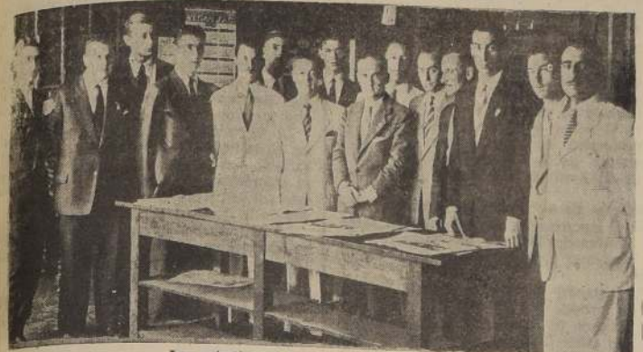
Los estudiantes argentinos en LA NACION

LOS ESTUDIANTES ARGENTINOS EN "LA NACION"