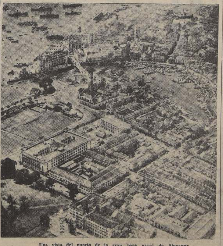
Una vista del puerto de la gran base naval de Singapur

DESDE UNA BASE DE SUPERFORTALEZAS EN LA INDIA, 1.º (U. P.).—Las Superfortalezas del XX. Comando lanzaron esta mañana toneladas de poderosos explosivos sobre el dique flotante y la base naval de Singapur, y las fotografías del reconocimiento indican que el gran dique quedó completamente destruido.