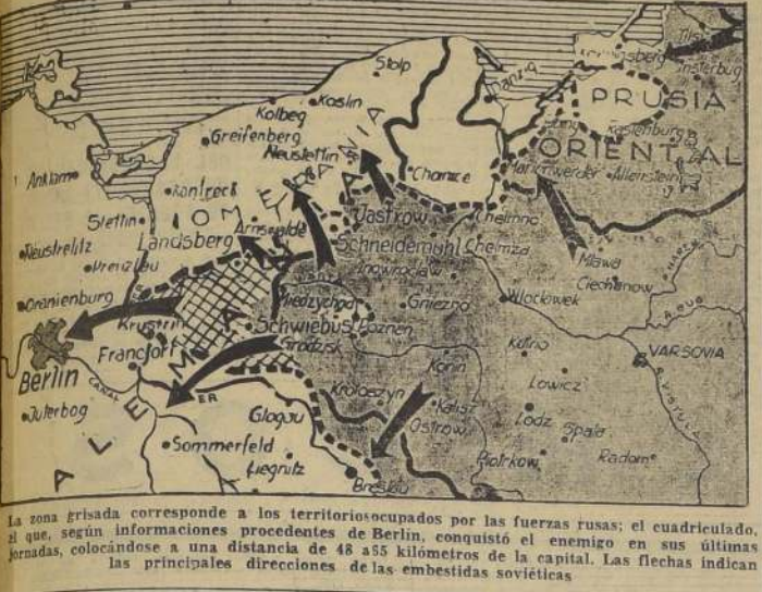
La zona grisada corresponde a los territorios ocupados por las fuerzas rusas; el cuadrado, al que, según informaciones procedentes de Berlín, conquistó el enemigo en sus últimas jornadas, colocándose a una distancia de 48 a 55 kilómetros de la capital. Las flechas indican las principales direcciones de las embestidas soviéticas.