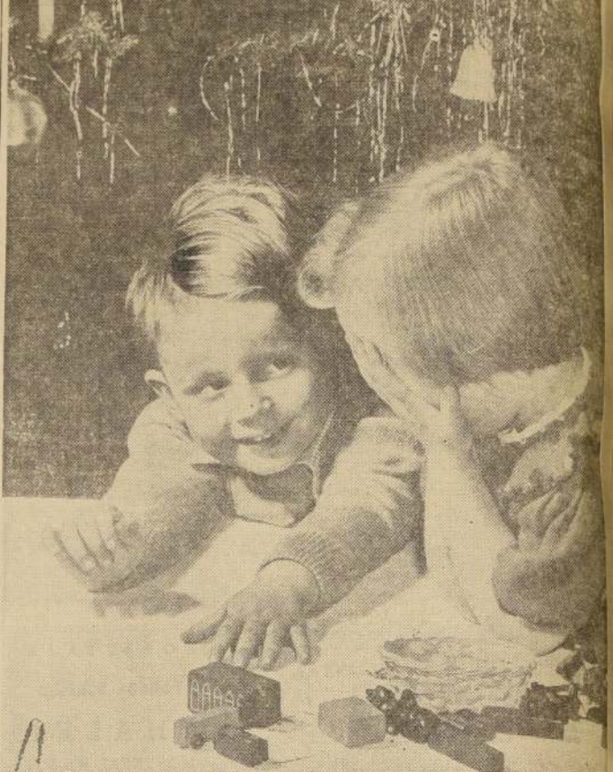
Y la alegría y el amor inundan el mundo de los niños. La silueta del abeto cargado de luces, cual estrellas de los cielos, preside el ceremonial, indicando el camino de las alturas. Por hoy, al menos, el universo es de ellos en la infinitud del tiempo y el espacio.