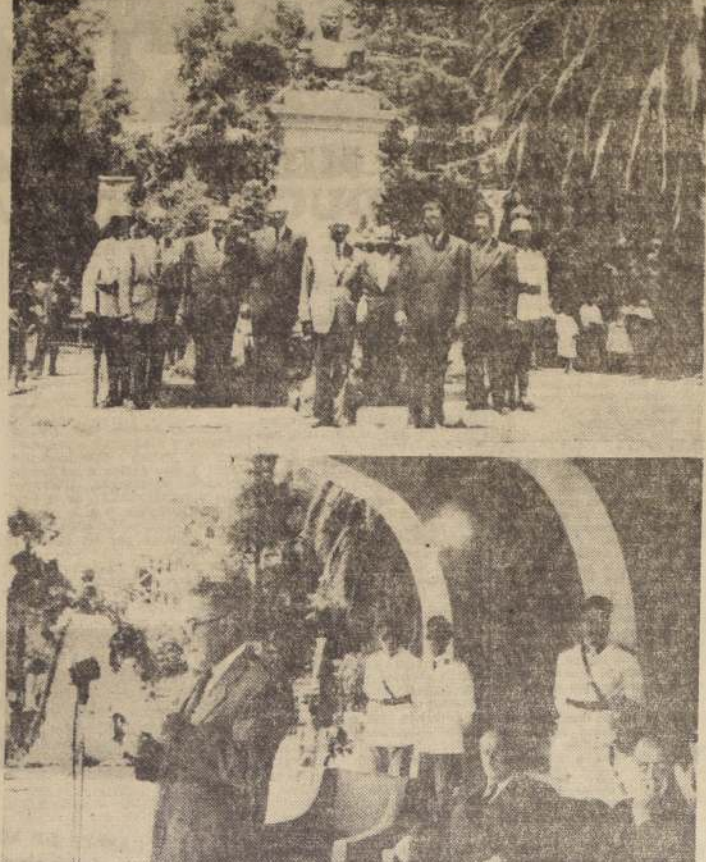
Don aspectos de la ceremonia en que Rotary Club de Cauquenes hizo entrega a la ciudad de un busto al prócer de la Independencia, General don Bernardo O'Higgins, fundado en bronce y erigido en el sitio más concurrido de la Plaza de Armas de la localidad. Arriba, la directiva del Rotary Club al pie del monumento.

CONCURSO DE ADMISION PARA EL AÑO 1957. Se llama a Concurso de Admisión para llenar vacantes de Cadetes en las siguientes Ramas: DEL AIRE - INGENIEROS - ADMINISTRACION DEFENSA ANTIAEREA.