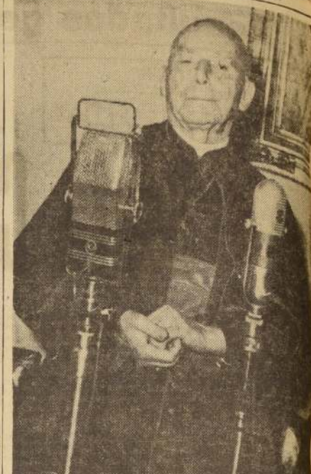
Monseñor José María Caro, Cardenal-Arzbispa de Santiago, envió anoche un mensaje navideño a todo el país por vía de una emisora nacional de radioemisoras de la capital.