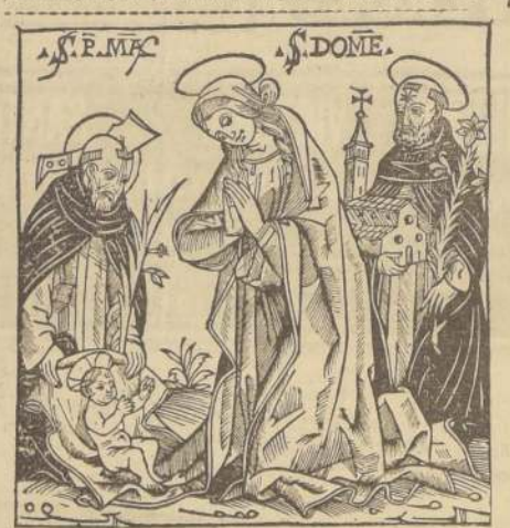
La adoración del Niño-Dios y la institución de la Iglesia como continuadora del Mensaje que dejara a los hombres, es recordada en este grabado de madera, de autor anónimo, Milán, 1518.