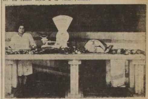
Un aspecto del Puesto del Mercado (Ismael Valdés 884, Teléfono N.º 80179). Hay existencia permanente de las más variadas, esperes a su disposición

desparadas de pescado, a almacén bien refrigerado mientras no se consume, y a exportación al público con el máximo de higiene mientras se va vendiendo.