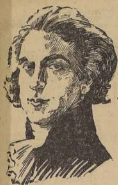
ABEL GANCE (Autor de la obra)