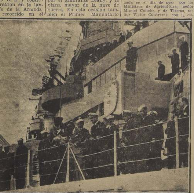
La cubierta del "Wisconsin", el Presidente de Chile responde a las aclamaciones de que es objeto.