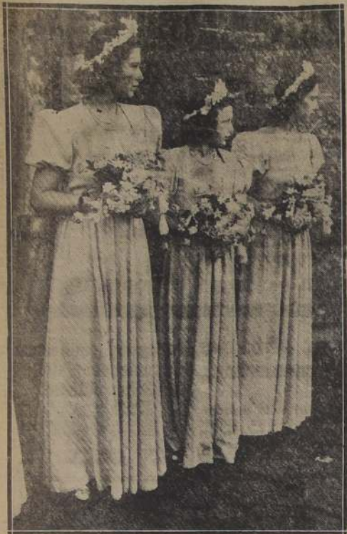
Las tres princesas de Gran Bretaña, durante el matrimonio de la hija de Lord Luis Mountbatten. De izquierda a derecha, princesa Isabel, heredera del trono británico; la princesa Alejandra de Kent, y la princesa Margaret Rose, después de efectuarse la ceremonia.