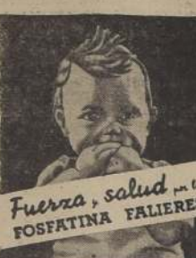
Fuerza, salud y FOSFATINA FALIERES