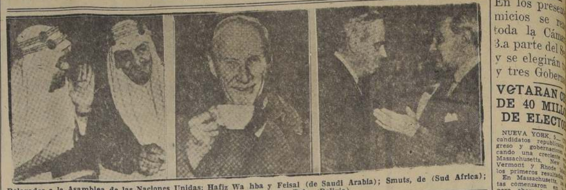
Delegados a la Asamblea de las Naciones Unidas: Hafiz W. hba y Faisal (de Saudi Arabia); Smuts, de (Sud Africa); Gutiérrez Nájera (México), y Costa del Rels (Bolivia).