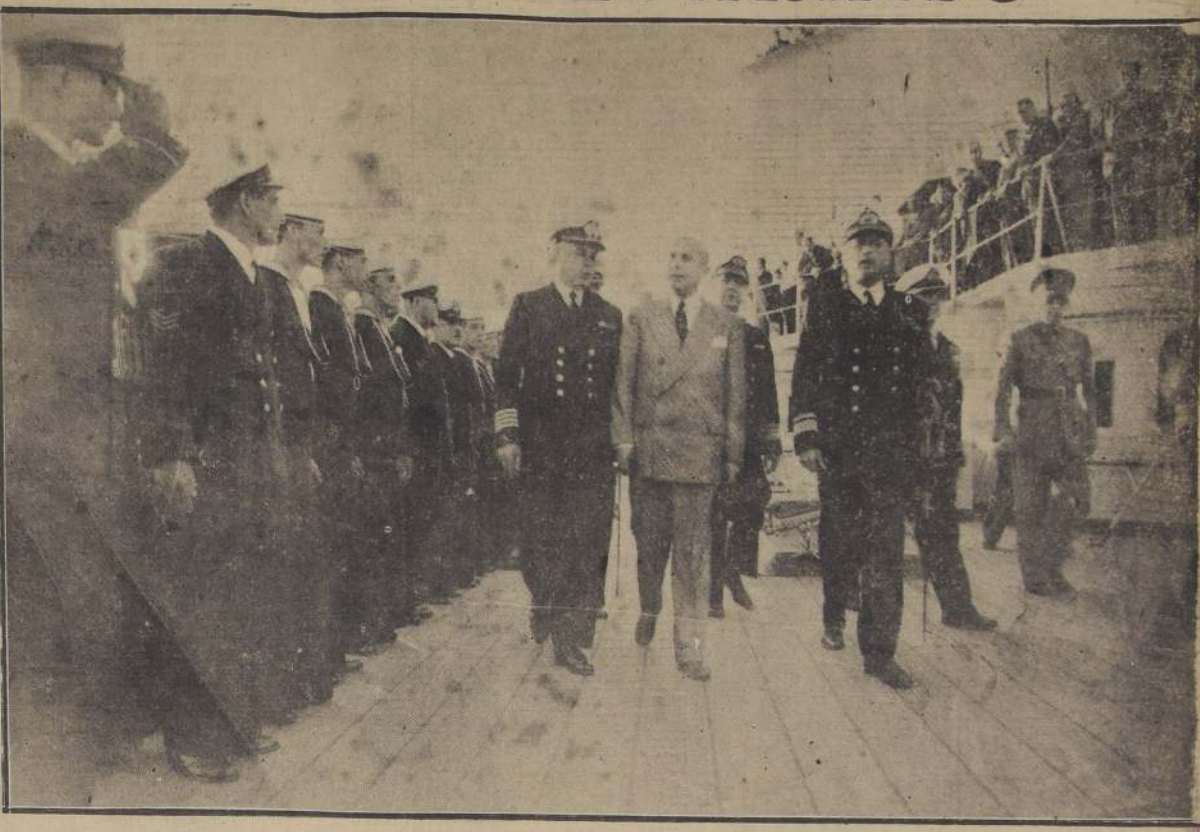
El Excmo. señor González Videla a bordo del acorazado "Almirante Latorre"