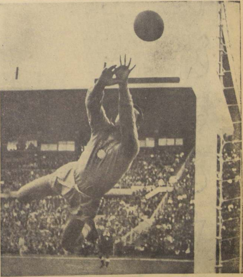
LA MEJOR FIGURA del Brasil fue Gilmar, arquero de extraordinaria calidad. Especialmente cuando los campeones mundiales se vieron acorados por el ataque nacional, surgió Gilmar con su clase incomparable. A la postre fue su arquero lo mejor que nos mostró Brasil en sus dos encuentros con Chile por la Copa O'Higgins, que reituvieron. En la acción, Gilmar se luce con uno de sus felinos saltos.