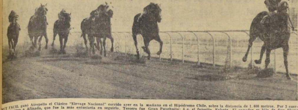
MUY FACIL ganó Atropello el Clásico "Elevage Nacional" corrido ayer en la mañana en el Hipódromo Chile, sobre la distancia de 1.400 metros. Por 3 cuerpos se impuso a Afinada, que fue la más entusiasta en seguirlo. Tercero fue Gran Puyehuito. 4.º el favorito, Falsete. El ganador es hijo de Sun Flame y Musiquita, y tiene una campaña brillante en triunfos clásicos.

Se multó en 15 escudos a J. Martínez por levantar a Ashley en los últimos metros. Las suspensiones aplicadas en esta carrera a los jinetes, rigen desde el día 15; las suspensiones aplicadas a los caballos rigen desde el día 12.