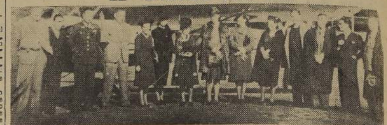
Parte de los asistentes al festival aéreo en honor de la prensa