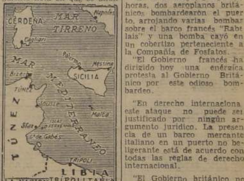
Mapa parcial del Mediterráneo indicando el puerto de Sfax, Túnez y otros lugares cercanos.