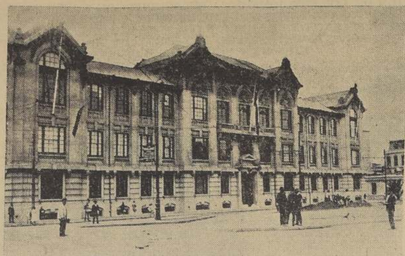
La Universidad Industrial de Valparaíso

Para ser matriculado en el primer curso preparatorio de cualquiera de las carreras industriales y en el primer año de comercio se exige: Haber terminado satisfactoriamente el tercer año de humanidades, o poseer conocimientos equivalentes, comprobados con certificados