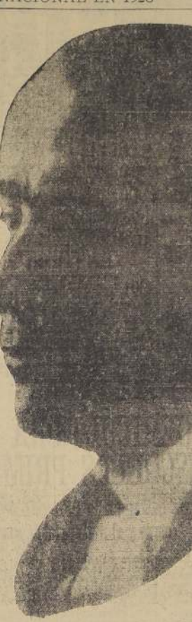
Don Conrado Ríos Gallardo

Entre las reformas más importantes, cabe destacar la reorganización de los servicios diplomáticos y consulares, la creación de nuevos departamentos, y la mejora de los procedimientos de selección y promoción de los funcionarios.