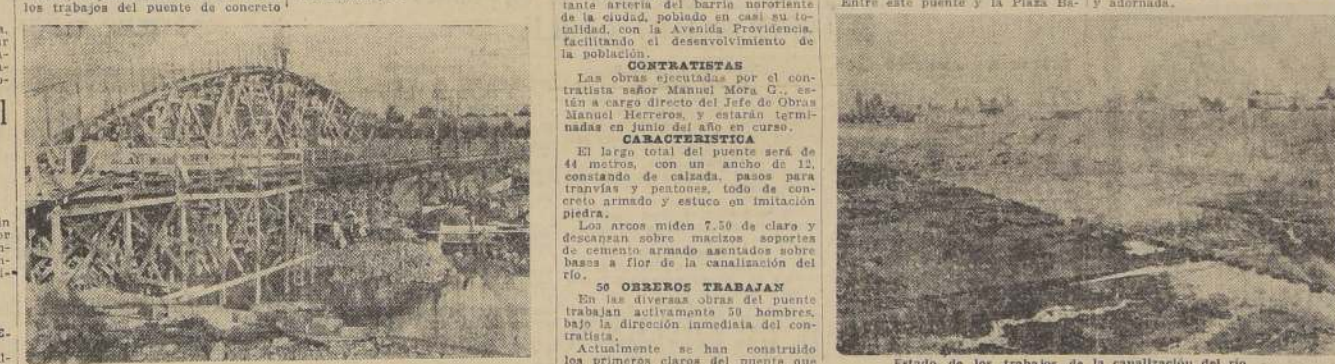
Armadura de uno de los arcos

En la tarde de ayer efectuamos una visita al barrio de Bellavista, donde se están realizando los trabajos para la construcción de un nuevo puente que unirá el barrio de Bellavista con el barrio de Providencia.