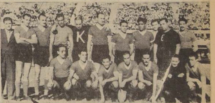
La delegación del Club Ferrocarril Oeste, de Buenos Aires, equipo que debutó ayer en Chile con una derrota e impresionando en forma desfavorable.—El seleccionado universitario, sin cumplir una performance valiosa, se impuso por 2-1.

Esos triunfos conseguidos por Ferrocarril Oeste—equipo popular del barrio Caballito, de Buenos Aires—sobre los "grandes" del balompié argentino y que valieron de meritos antecedentes para aumentar la atracción de su gira a Chile, no podemos considerarlos, luego de haberlos visto expeditos ayer, sino como uno de los muchos casos extraordinarios que ofrece este juego que, siendo de abierta competencia, admite también sorpresas y resultados, no ajustados a los títulos de los protagonistas. No es agradable dar comentarios desfavorables para un elenco extranjero que debuta; pero estamos firmemente convencidos de que el Ferrocarril Oeste, que perdió con los Universitarios, no es ni un remedo del mismo equipo que actúa en la serie privilegiada del campeonato de Buenos Aires. Es posible aceptar todos esos factores adversos que, por lo general, adornan una presentación de estreno, pero creemos que ellos no son capaces, como en el caso presente, de disminuir tanto el poder efectivo