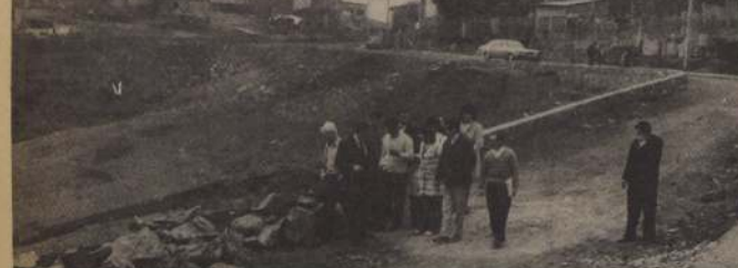
LOS POBLADORES TOMARÁN parte activa en el proyecto de obras de alcantarillado que inicia la semana próxima la Empresa

Con respecto a la ciudad de Viña del Mar se iniciarán también la próxima semana las obras de la Población Libertad, con la extensión de 135 metros y colocación de tres cámaras con un costo de E$ 31.318.06, que incluye aporte de mano de obra de los pobladores. Por último se ha programado para el comienzo de la colocación de 699 metros en San Vicente de Forestal, que corresponde a las zonas E y F, con inversión de E$ 436.795.02 con aportes económicos de vecinos.