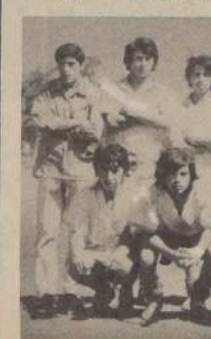
EQUIPO de fútbol formado por campesinos, que nació en el Curso de Orientadores Deportivos efectuado en la Hacienda "El Tanque", en enero de 1972.

Cumplida la parte inicial del plan, los orientadores aprobados, comenzaron el trabajo propiamente dicho y que consistió en su fase primera a la construcción de canchas de fútbol, básquetbol y fútbol, que a su vez tuvieron un carácter primario sirvieron para que los campesinos tomaran un contacto directo con el deporte y comprendieran mejor el valor que esta actividad tiene en el desarrollo de la comunidad.