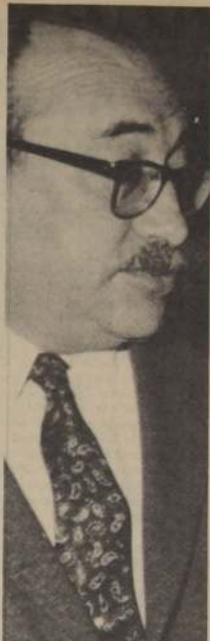
CLODOMIRO ALMEYDA, Ministro de Relaciones Exteriores de Chile

También en ese mismo barrio, está el Liceo "José Martí", en el acto de hoy se encontraba presente otra escuela que también lleva el nombre de otro héroe de la revolución cubana.