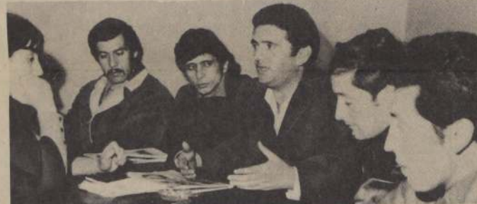
DIRIGENTES DE LA JJCC. de Valparaíso en conferencia de prensa

9.- "Luchar Trabajar y Estudiar por la Patria y la Revolución". Comité Regional JJCC Valparaíso.