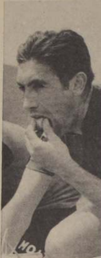
EDDY MERCKX Otra vez en la tradicional Vuelta Ciclista de Italia.