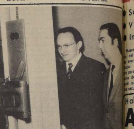
El Ministro Consejero de la Embajada de la República Democrática Alemana en

Estos dos conjuntos instrumentales actuarán en Santiago, siendo posible su inclu-