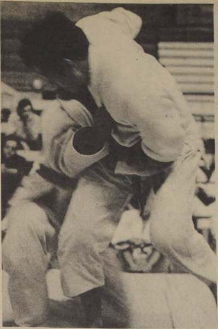
"Con técnico japonés subiremos la jerarquía del judo nacional y alcanzaremos un nivel superior al de Buenos Aires", afirma el