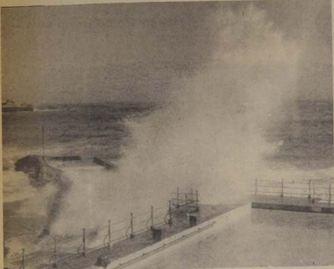
Intensas lluvias y marejadas se iniciaron la madrugada del martes en Valparaíso, en tanto que las olas, como es tradicio-