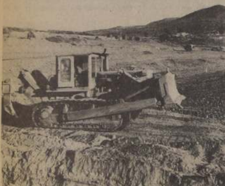
"CONVENTO VIEJO" es una de las construcciones hidráulicas con la que el Ministerio de Obras Públicas trata de paliar la falta de agua de regadío. También se encuentran en estado de construcción "Valle de Aconcagua", "Colbún" y otras.

Es así como este Primer Seminario de aprovechamiento de recursos de agua a nivel nacional, traerá como consecuencia la solución a muchos problemas, tanto en el agro como de carácter social, pues los lugares donde los habitantes deben sufrir la escasez de agua potable, tendrán en futuro próximo disponibilidad suficiente de este elemento.