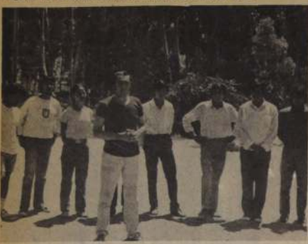
INSTRUCTOR de la UTE, en una clase de Recreación y Deportes para los campesinos en el curso de Orientadores Deportivos, realizado en la Hacienda "El Tanque".