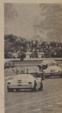
Dos fechas seguidas en Arica, para los bríos de Turismo Carretera.