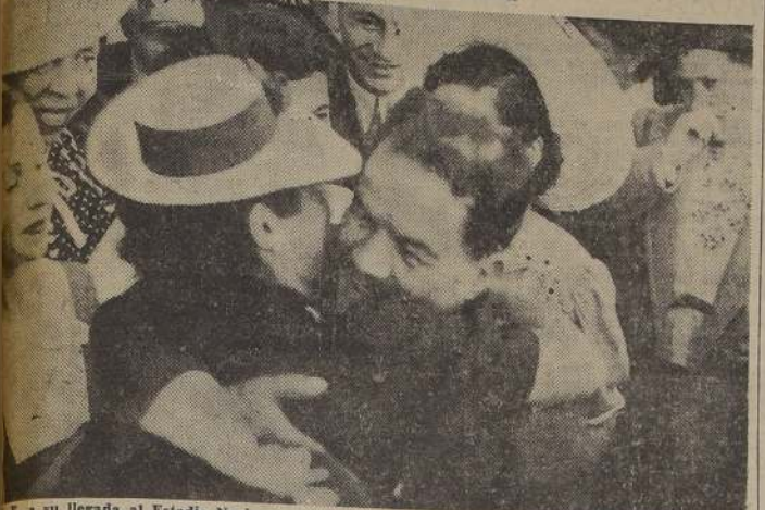
A su llegada al Estadio Nacional, saluda a una de las alumnas distinguidas de la Escuela de Verano

S. E. el Presidente de la República asistió ayer al cocktail ofrecido por el Ministro de Educación en honor de los profesores y alumnos de la Escuela