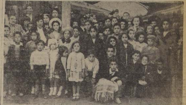
Familias de obreros de Magallanes que llegaron ayer

Este grupo de familias está compuesto por obreros y escolares, que conocerán por primera vez la capital