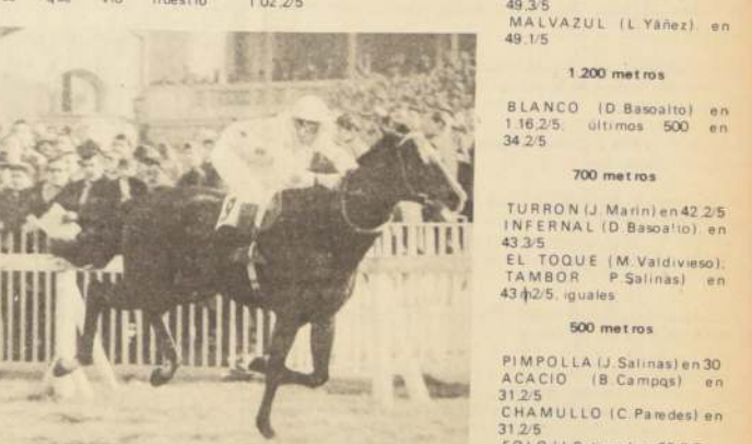
Hostigador, que dio excelente sport el domingo en el Club Hípico.