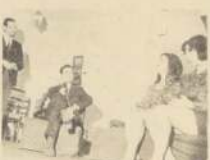
Entre "Los Cuatro" hacen "La Pareja" en el Petit Rex.