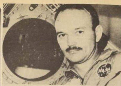
El astronauta Michael Collins, luciendo un grueso bigote que se dejó crecer cuando pasó el tiempo en la Apollo 11, sale de la cámara de cuarentena donde se le confirió junto con Armstrong y Aldrin, luego que volvieron de la Luna.