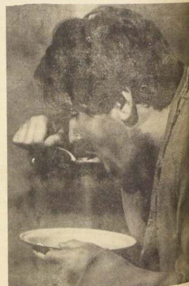
Nelson Villagra, en una de sus caracterizaciones de hombre del pueblo, en la película "El Chacal de Nahuelbuta" Miguel Littin.

Esta crónica dramática juega con el tiempo y con el espacio. Se ha realizado un montaje que la hace fácilmente transportable a provincias.