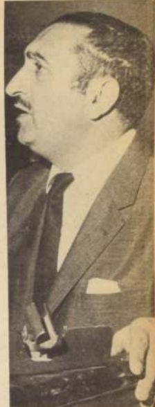
MINISTRO HALES. "La nacionalización del cobre en Zambia podría provocar un alza del metal en el mercado".

Finalmente, el Ministro de Minería atribuyó a una simple coincidencia que haya sido primero Chile y después Zambia los que realicen la nacionalización del cobre.