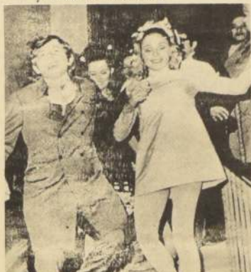
Sharon Tate y Roman Polanski, el día en que contrajeron matrimonio, saludados por sus amigos.

Ahora su hogar ha quedado deshecho por un vendaval criminal que clava su dardo en el centro de las más angustiosas preocupaciones del celebre director.