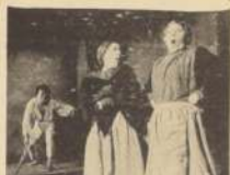
Don Jesucristo reprende a las comadres copuchentas en el Varas.