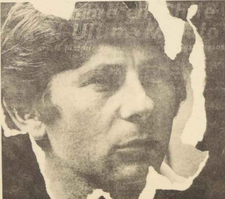
Roman Polanski, el torturado director de cine polaco, tal como fue presentado.

Realiza luego varias películas que merecen más elogios de la crítica que repercusión inmediata en el público. Entre ellas está "La Danza de los Vampiros", realizada para la Paramount, en los Estados Unidos. Cuando dirigía la filmación de esta película, Roman Polanski conoció a la joven y hermosa actriz Sharon Tate, con quien se casó en 1967.