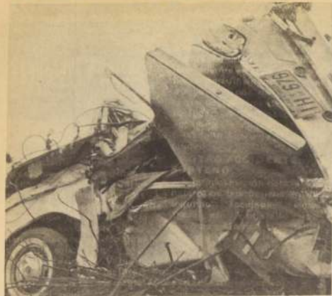
LOS ACCIDENTES DEL TRÁNSITO Y CARRETEROS siguen menudeando en nuestro país, a pesar de las campañas iniciadas por las autoridades pertinentes. En menos de 24 horas se registraron accidentes que dejaron un saldo de seis muertos y más de 14 heridos.

La muerte sigue al acecho en los caminos