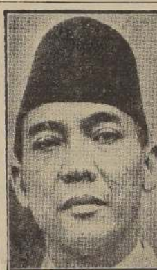
El Dr. Sukarno

Según la opinión de los círculos bien informados que tras estas conversaciones, el próximo paso de importancia será una reunión de los tres grandes o la reanudación de las sesiones del Consejo de Ministros de Relaciones Exteriores, o, posiblemente, ambas cosas.