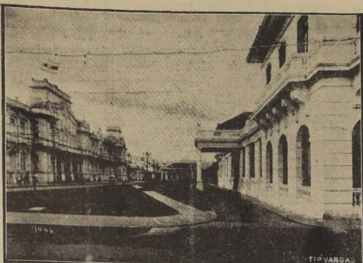
Un aspecto de la ciudad de San José de Costa Rica. A la izquierda el Palacio de Gobierno

Dijo que sus relaciones con la Federación de Trabajadores de Chile, son optimistas. Sobre el cambio de regímenes en Venezuela y Brasil no opina, porque estaba ausente cuando ocurrieron estos acontecimientos. Aseguró que no hay fascismo. Sobre Argentina no comparte algunos temores débiles, pues la interdependencia de las naciones es una realidad. Sobre España, dijo que para la Madre Patria com