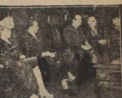
Personalidades que presidieron el acto de ayer