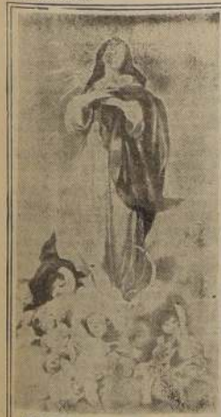
MES DE MARIA

El libro de Sabella nos muestra el aspecto de las actividades de la Escuela de Medicina, integrando la selección de libros que ponen de relieve las múltiples facetas de la enseñanza universitaria.