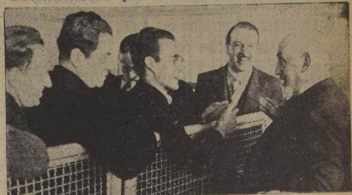
Don Angel Ossorio y Gallardo a su llegada a Cerrillos es interrogado por un representante de "LA NACION".