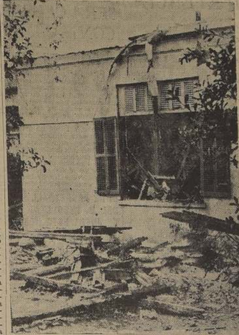
Lo único que queda en pie, del edificio de tres pisos que ocupaba la Legión Checa.

Gracias a la oportuna intervención de sus compañeros, pudo ser extraído antes de que muriera por asfixia. Sin embargo, los voluntarios eran de tal gravedad que debió ser trasladado a la Posta de Suñon, donde, des-