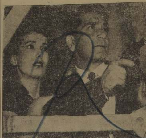
Richard Conte y Julia Adams, protagonistas de la película "Sucedio en Hollywood", de Universal-International, en una dramática escena del film, en el cual Richard Conte esclarece el asesinato de un célebre director de películas mudas, impune durante más de veinte años. Va hoy al Cervantes.