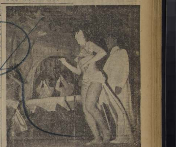
HOY DOS PELICULAS EN ROTATIVO