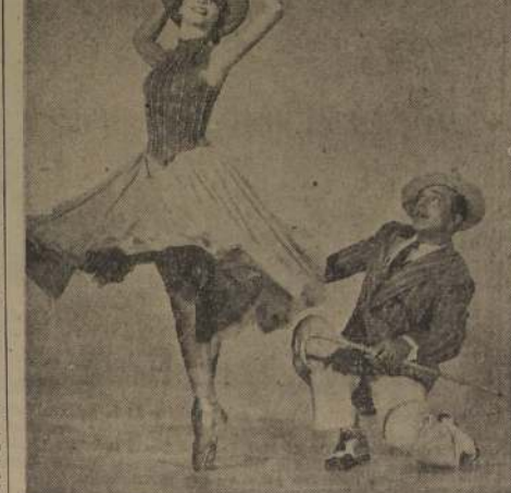
UNAS PIERNAS QUE ASOMBRAN — Leslie Caron, estrella francesa del ballet, demuestra a Gene Kelly, como se hacen las pruebas, en la película de la Academia de Hollywood, como "la mejor película de 1951"