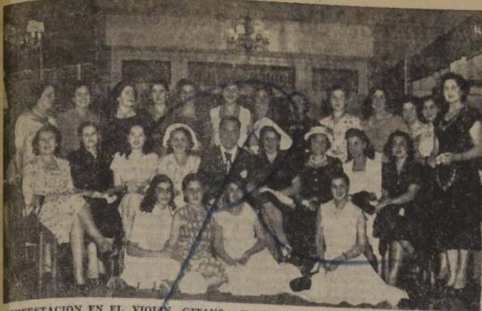
MANIFESTACION EN EL VIOLIN GITANO. —Simpáticos relieves alcanzó la despedida de solteras que sus relaciones ofrecieron a las señoritas Angela Gosen y Blanca Tala, en los elegantes salones del Violin Gitano. Los asistentes a esta manifestación posaron con el astro cinematográfico Alberto Castillo, que les brindó sus mejores creaciones. Se trata de la nueva modalidad del Violin Gitano, "manifestaciones con su astro favorito".