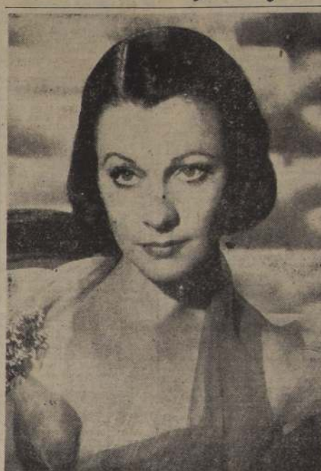
VIVIEN LEIGH.—Obtuvo por segunda vez el codiciado "Oscar", estatilla de oro que otorga la Academia de Ciencias y Artes Cinematográficas de Hollywood, por su actuación en el film "The African Queen".

El ministro de Hacienda informó en las últimas horas de la tarde, que aun no se había resuelto en qué país se harían estas compras, pero que no era improbable que se hiciera con las disponibilidades que tenía el país en Alemania.