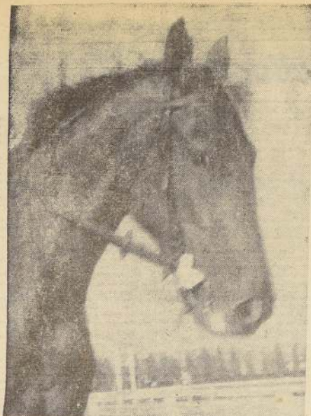
FOLENTA, opción secundaria en el Clásico "República de Panamá", que se correrá el próximo domingo en el Chile. Ha trabajado muy bien y aunque no se ha visto tan corredora como otras puede hacer un buen papel.