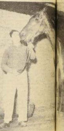
Gaekwar, por Forest Row 3