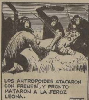
LOS ANTROPÓIDES ATACARON CON FRENESÍ, Y PRONTO MATARON A LA FEROCÍ LEONA.