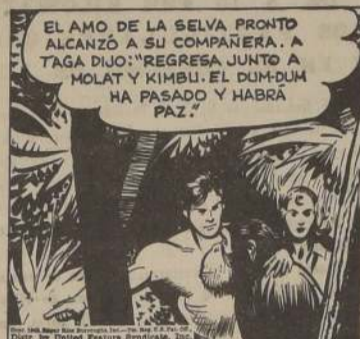
EL AMO DE LA SELVA PRONTO ALCANZÓ A SU COMPAÑERA. A TAGA DIJO: "REGRESA JUNTO A MOLAT Y KIMBU. EL DUM-DUM HA PASADO Y HABRÁ PAZ."