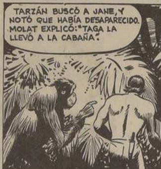
TARZAN BUSCÓ A JANE, Y NOTÓ QUE HABÍA DESAPARECIDO. MOLAT EXPLICÓ: "TAGA LA LLEVÓ A LA CABAÑA."