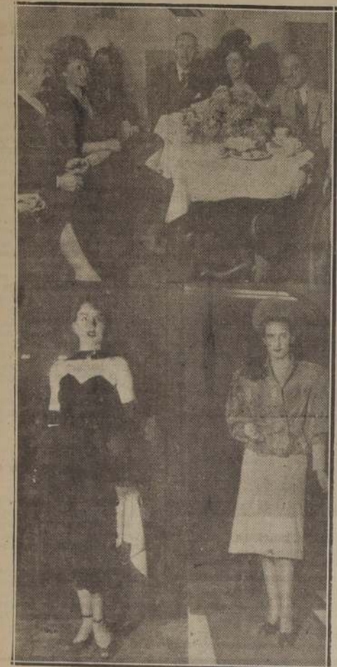
Unos aspectos del tea-bridge de beneficencia que se efectuó en los salones del Hotel Crillon, organizado por la Delegación de la Entente Française en Chile, en ayuda de las víctimas de la guerra.