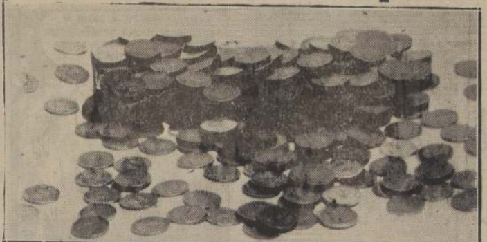
Monederos falsos están haciendo circular monedas de $ 1 burdamente falsificadas. El tamaño y el peso difieren fundamentalmente de los verdaderos.

Brigadas de detectives especializados buscan en estos momentos la pista de los falsificadores de monedas de un peso. Así fuimos informados