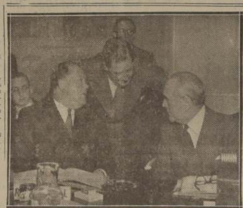
Momentos antes de celebrarse la primera reunión del Comité General del Primer Período Extraordinario de Sesiones de la Asamblea General de las Naciones Unidas, convocado a petición del Reino Unido de la Gran Bretaña, para considerar la cuestión de Palestina. De izquierda a derecha, el Secretario General de las Naciones Unidas, Trygve Lie; Herschel V. Johnson, representante suplente de los Estados Unidos de América; y Dr. Oswaldo Aranha (Brasil), Presidente de la Asamblea, así como del Comité compuesto de siete vicepresidentes y de los presidentes de los seis Comités principales. — Flushing Meadows, Nueva York, 29 de abril de 1947.

"En la región de Nueva Germania, luego de una brillante