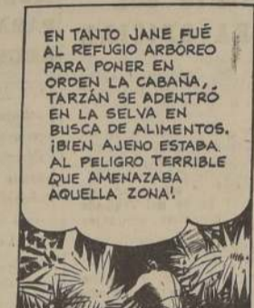
EN TANTO JANE FUÉ AL REFUGIO ARBÓREO PARA PONER EN ORDEN LA CABAÑA, TARZAN SE ADENTRÓ EN LA SELVA EN BUSCA DE ALIMENTOS. ¡BIEN AJENO ESTABA AL PELIGRO TERRIBLE QUE AMENAZABA AQUELLA ZONA!