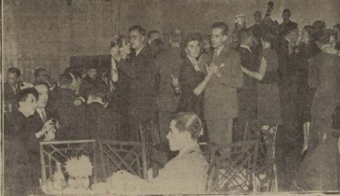
Aspecto tomado en la boite "Millarai" ubicada en el 1er piso del Hotel "Carrera"