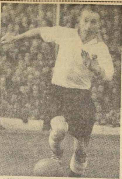
A LOS 48 AÑOS DE EDAD, todavía Sir Stanley Matthews sigue rindiendo como en su juventud. Un gol del extraordinario puntero inglés llevó al club Stoke a la División.