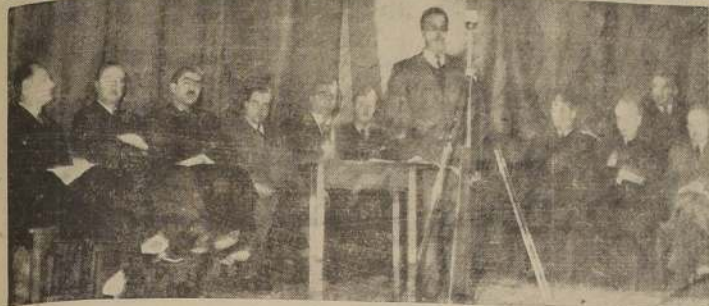
La Mesa directiva de la Concentración de Empleados Municipales.

EL 80 POR CIENTO DEL PERSONAL PERCIBE SALARIOS MENORES QUE EL VITAL. — SE LUCHARA HASTA LOGRAR LA REALIZACION DE SUS JUSTAS ASPIRACIONES. — EL PROYECTO DE NUEVAS RENTAS MUNICIPALES