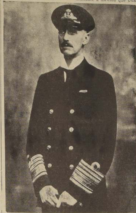
S. M. el Rey Haakon VII

veinte o treinta años todos ustedes pueden estar muertos y entonces el pueblo noruego puede venir a mí y decirme: "¿Qué diablos está Ud. haciendo aquí?" No hubo pues forma de reducirlo, y el plebiscito se llevó a cabo el 12 y 13 de noviembre de 1905, dando como resultado 259.563