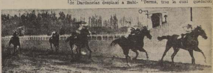
Quebranto derrota a Santiada, Campolo y Mercurial

LA DE CLAUSURA Puso término al programa la cuarta serie de los compromisos de velocidad, que fué ganada de extremo a extremo por nuestro recomendado Novilunio. Alzadas las cintas y definidas claramente las posiciones, Novilunio pasó a dirigir la carrera cortándose dos cuerpos sobre Terna, tras la cual quedaron