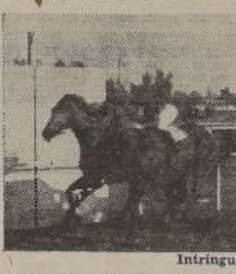
Intrínquis aventaja a Cayalca, Cadete y Lamartine

primero por la distancia mínima. La "sueta" se hizo en espléndidas condiciones, y Fragata hizo de leader, custodiada por Domitila, quedando tercero Maillo, delante de Rey Mago, y con Edgar Poe en la última línea. Enfilada la recta opuesta y definidas claramente las posiciones, Fragata corrió con 3 cuerpos de ventaja sobre Domitila, que precedía por cuatro a Maillo y Rey Mago que actuaban casi juntos, y cerrando el paso, a unos tres largos, Edgar Poe. Faltando una milla, Maillo fué desplazado por Rey Mago, y una vez entre codas, las dis-