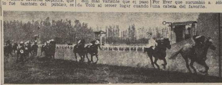
Atacama delante de Santita, Desmayada - Tolú