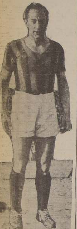
Isidro Lángara, el notable delantero que vendrá con San Lorenzo

En seguida lo harán los teams del River Plate y Boca Juniors, clubs que mantienen intactas sus aptitudes reconocidas a través de su larga figuración en las canchas de Argentina, donde están catalogados, con justicia, como instituciones "grandes" del deporte de ese país. Están aún cercanas sus actuaciones en nuestros fields, que fueron siempre demostraciones de un poderío que sólo alcanzan entidades que se preocupan de sostener el prestigio acumulado durante memorables jornadas.