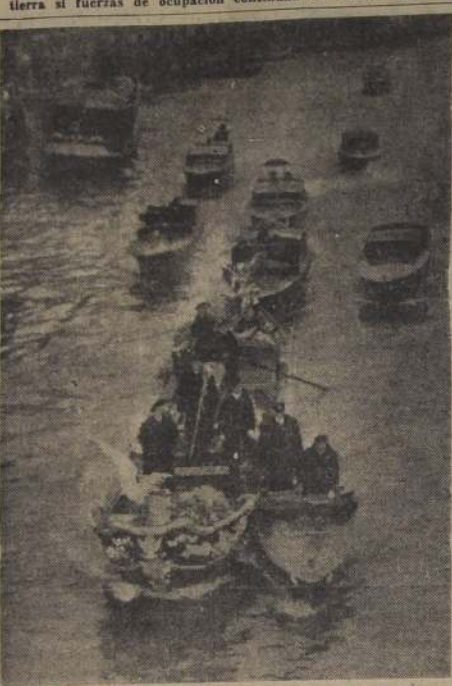
FUNERALES EN GONDOLA DEL PATRIARCA DE VENECIA.

Los funcionarios informantes dijeron que, con estos protocolos arreglados, se puede esperar "bastante rápidamente" la ratificación del Tratado por la Asamblea Nacional.