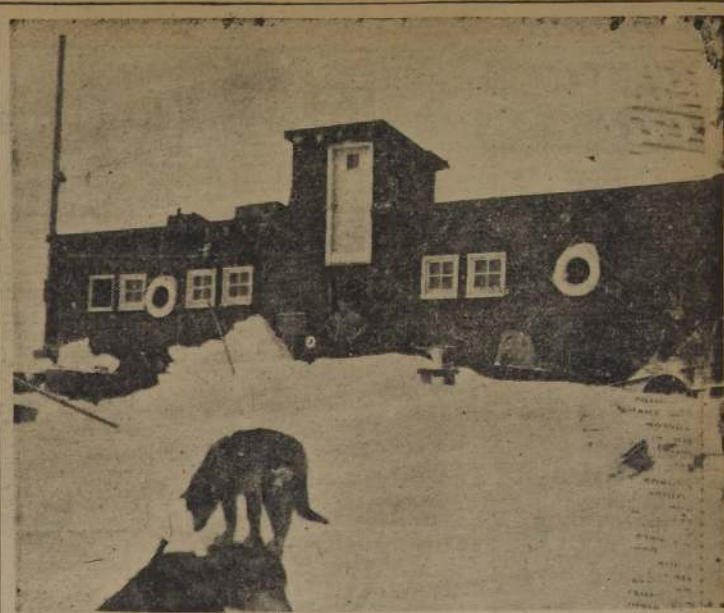
CUARTEL DEL EJERCITO CHILENO EN LA ANTARTIDA. — Este es el cuartel en el que viven durante un año, los siete hombres del Ejército que cubren la guarnición de la Base O'Higgins. El edificio ha sido dotado, año tras año, con las mejores comodidades posibles para su personal. En el grabado aparece rodeado de nieve, destacándose la torre con su elevada puerta que a veces utiliza el personal para salir cuando la nieve cubre gran parte de la edificación que está pinada con alquitran. En primer término, se ve a dos perros del magnífico criadero que mantiene la base, y que cuenta actualmente con más de 30 animales hábilmente adiestrados para las faenas en la nieve.