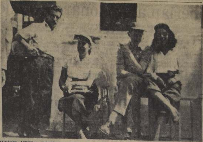
BUENOS AIRES. — Estudiantes chilenos que viajaban en el vapor español Monte Urbasa, que tuvieron un violento choque con el petrolero danés Rosa Maersk, posan para los fotógrafos mientras esperan continuar viaje en otra nave. Resultaron heridas tres estudiantes chilenas en la colisión. Ninguna de ellas cayó al agua.

Fueron retirados los cuerpos y se comprobó que cuatro personas habían sido sepultadas de las cuales una menor pereció cuando era conducida al primer puesto de socorro.