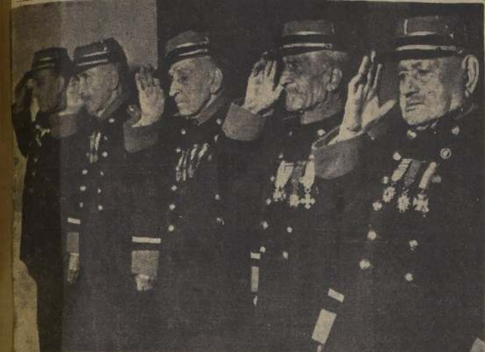
SÍMBOLOS DEL PASADO HEROICO. — Con una arrogancia marcial que venció a los años, los viejos y gloriosos soldados, luciendo los mismos uniformes que vistieron en la epopeya del 79, se encuentran en un saludo que más que el seco simbolismo militar posee, también, un honor de ternura humana. Los que aún quedan montando guardia en los recuerdos, saludan a los que ya se fueron, a los que los precedieron en el viaje definitivo. El Día del Veterano, que se celebra hoy, sólo encuentra a 100 veteranos con vida. — (Información en la página 2)

El Ministerio de Economía dictará los decretos respectivos hoy