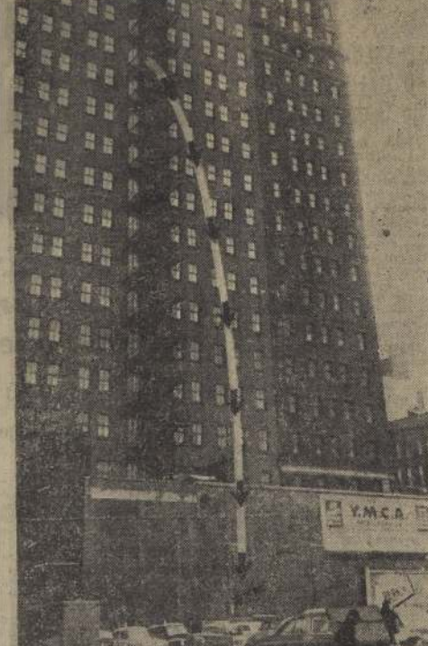
SE LANZO DESDE EL PISO 14.0, PERO TODAVIA VIVE.

Un funcionario dijo que "hay informes contradictorios sobre el acuerdo pactado en Kartum; es una situación sorprendente".