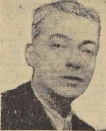
audición extraordinaria para América Latina.

La E. C. A. de Londres ofreció con su producción una