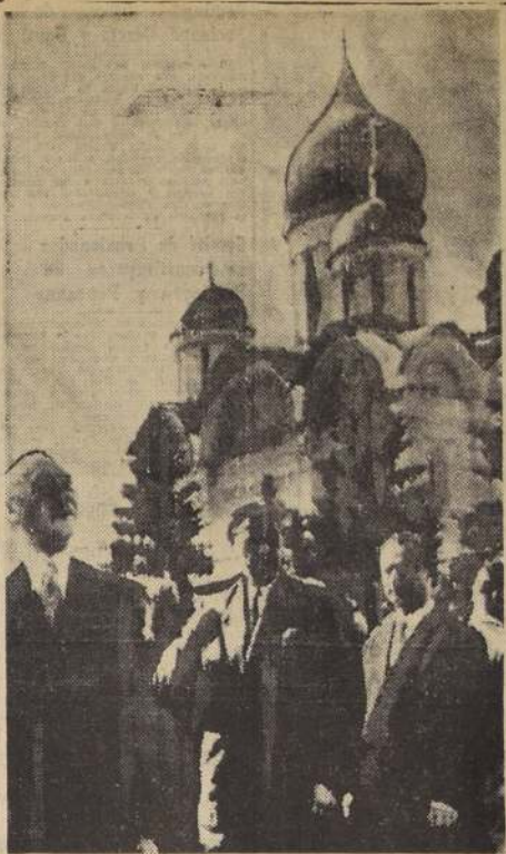
KONRAD ADENAUER EN MOSCÚ.— MOSCÚ.— El Canciller de Alemania Occidental, Konrad Adenauer, aparece en la fotografía que se le tomó mientras visitaba diversos puntos de interés de la URSS. Adenauer tuvo una notable actuación, que le permitió pactar acuerdos de la más alta importancia.

EL PROBLEMA DE LA REUNIFICACIÓN.— El otro gran problema entre Alemania y Rusia, la reunificación de Alemania, fue simplemente mencionado en el comunicado, que dice que esta aspiración básica alemana se verá favorecida por el establecimiento de relaciones diplomáticas normales.