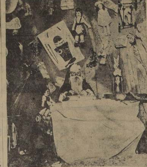
Santa Claus, rodeado de juguetes y ante el libro en que registra las direcciones de los pequeños que van a visitarlo

Finalmente, una palmaria en la media y un consejo para que continúen siendo buenos por término a la entrevista, y los niños salen felices de la gruta, contando desde ese momento las horas que faltan para el momento que Santa Claus ha