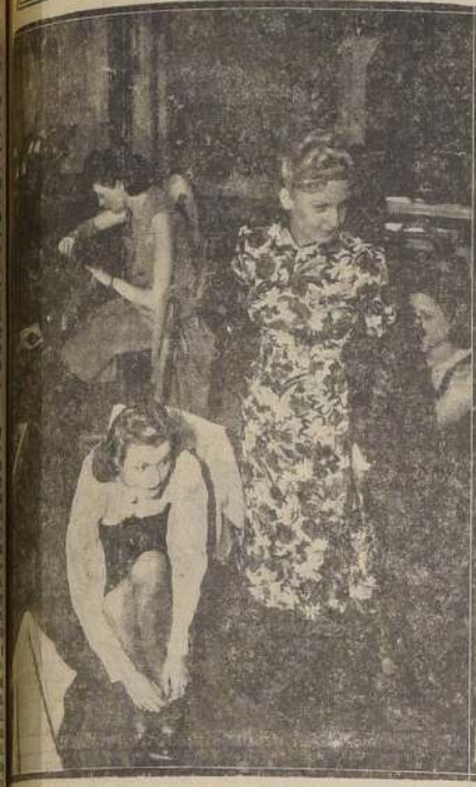
Vista clásica de un taller de costura parisien