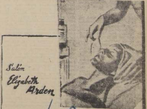
Salón Elizabeth Arden

NUOVO SISTEMA DE PESCA. — Una combinación de radar y equipo sonoro del tamaño y aspecto de un receptor de radiotelefonía común, de uso familiar, ha comenzado a utilizarse en los EE. UU., en los barcos pesqueros. Se lo emplea en la localización de bancos de peces —o cardúmenes— lo mismo que en la localización de masas de hielo flotantes (icebergs), que constituyen un gran peligro para las embarcaciones. Los resultados son muy buenos; los barcos equipados con estos elementos han logrado pesca abundante y navegan con mayor seguridad.