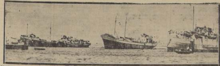
HAIFA.— Más de 4.000 judíos viven en la actualidad a bordo de barcos anclados en este puerto en espera de una oportunidad para desembarcar en Palestina. (Foto Acme).