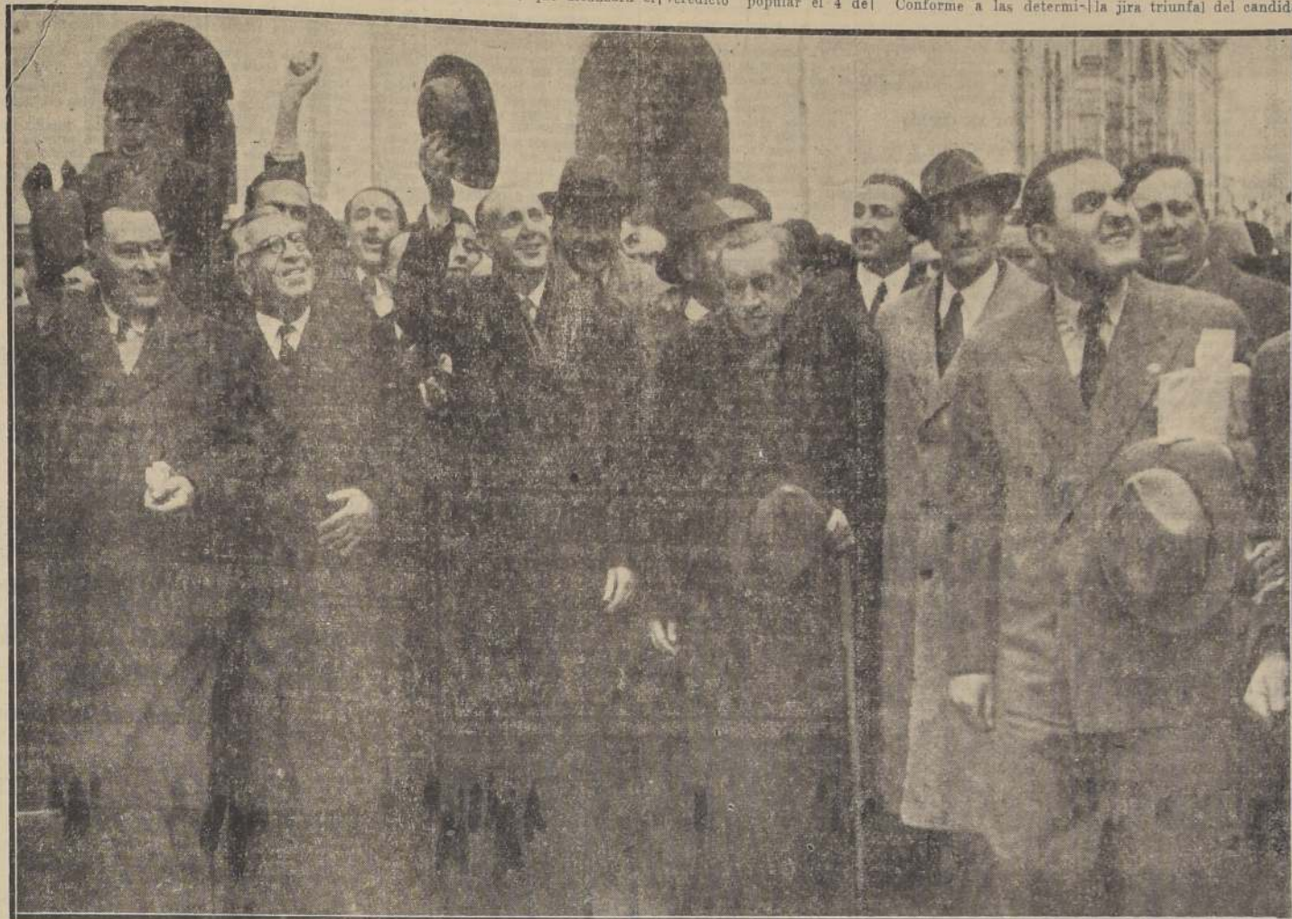
Don Fernando Alessandri, acompañado de su padre y dirigentes de su candidatura, saluda a sus partidarios de Curicó, que lo ovacionan entusiastamente.

DOMINGO 25. — Llega a San Fernando a las 10 horas. Sale de San Fernando a las 12.30 horas. Llega a Rengo a las 13 horas. Sale de Rengo a las 16.30 horas. Llega a Alameda a las 18.45 horas.