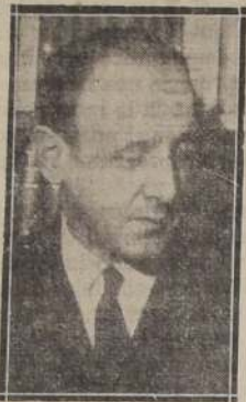
D. Fernando Alessandri Rodríguez, candidato del Frente Nacional.