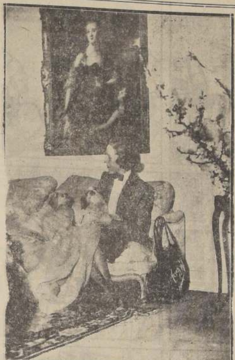
Maggy Rouff, una de las más afamadas modistas de París, en su casa de París, con sus pekinéses regañones