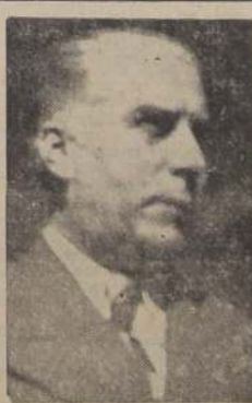
poesía castellana, como lo reconocieron en su tiempo Unamuno y el mismo Juan Ramón Jiménez.