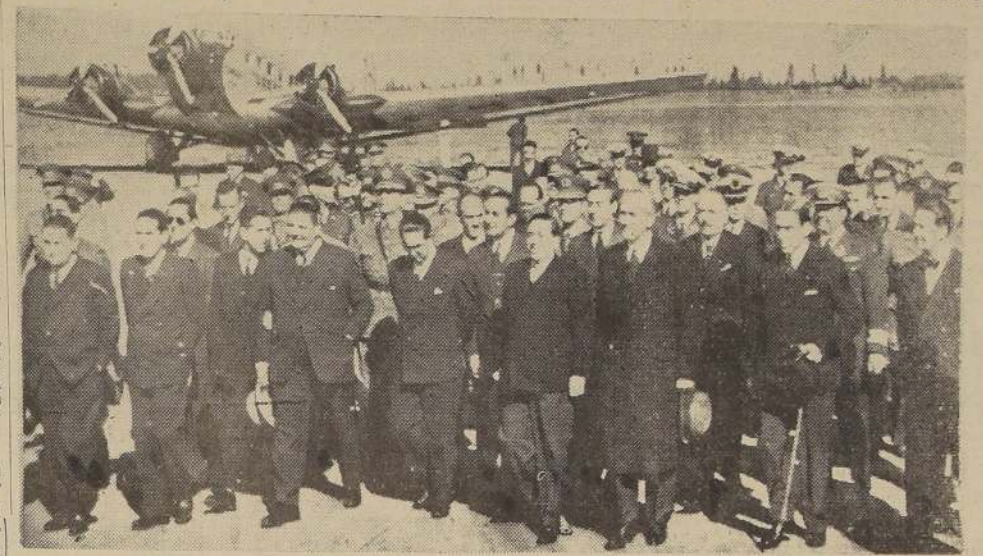
El Cancellor del Brasil señor Oswaldo Aranha y personalidades que le dieron la bienvenida a su llegada a Los Cerrillos

EL EXCMO. SEÑOR OSWALDO ARANHA Y COMITIVA LLEGARON POR VIA AEREA A LAS 16.15 HORAS, ACOMPAÑADOS DEL EMBAJADOR DE CHILE EN RIO DE JANEIRO