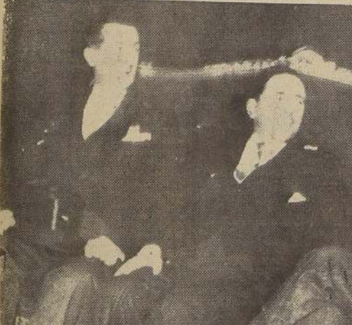
El Cancellor de Brasil conversa cordialmente con su colega chileno

Agrego: "No quiero estar en Chile como Ministro de Relaciones Exteriores del Brasil, quiero que se me considere como un simple ciudadano de mi patria que desea estrechar los vínculos de amistad chileno-brasileña, se mantenga inalterable a través del tiempo y de la distancia." Agrego: "No quiero estar en Chile como Ministro de Relaciones Exteriores del Brasil, quiero que se me considere como un simple ciudadano de mi patria que desea estrechar los vínculos de amistad chileno-brasileña, se mantenga inalterable a través del tiempo y de la distancia."