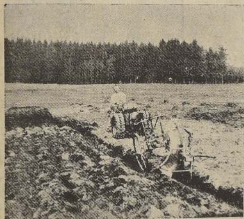
Las labores profundas efectuadas con tractor ahorran tiempo y trabajo.