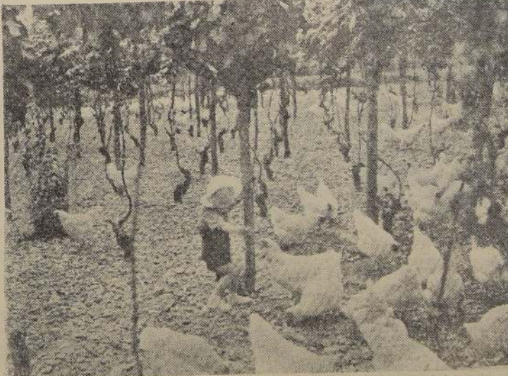
El suero en la alimentación de las aves, las estimula en el desarrollo y producción.

El suero proveniente de las lecherías es tal vez el más interesante de los subproductos de la leche, y su mayor valor consiste en su utilización para alimentar aves y cerdos. Cuando los terneros se crían separados de sus madres, al mes puede substituirse la mitad de la leche entera por descremada; en las aves puede emplearse un litro para cada 20 gallinas.