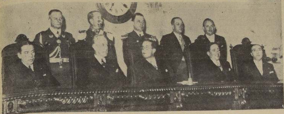
Mesa directiva de la sesión de la Municipalidad en honor del Excelentísimo señor Oswaldo Aranha