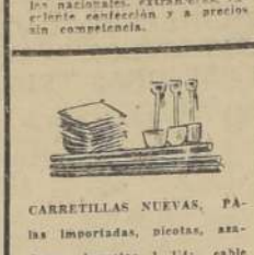
CARRETERAS NUEVAS, PA- las importadas, picotas, asa- dones; barreras 1 1/4; cable acero 2 1/4; fierro redondo 1", importado, cinco toneladas, líquida. San Pablo 2361.