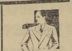
SASTRERIA "LA ELEGAN- cia", Banderas 416, Palma y link, a poco variada surtido te- los nacionales, extranjeros, va- riente variedad y a precios sin competencia.

200, GAY, CASITA 4 PIEZAS, gran patio, garage, Agua luz, ODE, Huérfanos 1175. 28-Z.