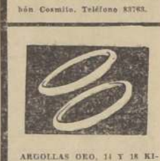
ARGOLLAS ORO, 14 y 18 Kilitos, macías, grabadas, desde $ 90 par. San Diego 780. Relojería Sportman.