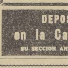
DEPOSITA SUS ECONOMIAS en la Caja de Crédito Popular SU SECCION AHORROS LE PAGA EL MAS ALTO INTERES