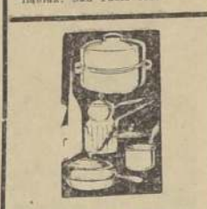
BATERIAS DE ALUMINIO PA- ra cocinas, vendemos en fabri- ca. Serrano 572.