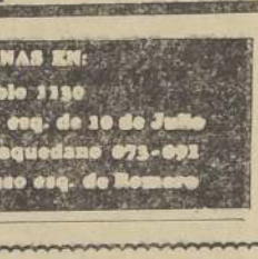
DEPOSITA SUS ECONOMIAS en la Caja de Crédito Popular SU SECCION AHORROS LE PAGA EL MAS ALTO INTERES