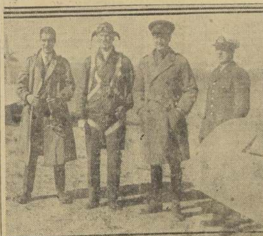
El Agregado Aéreo de la Embajada de Estados Unidos, capitán Wooten, que escoltó el avión en que viajaba el comandante Merino.

En este último punto combinará el trimotor con uno de los aviones de la Panagra que llevará a los señores Merino, Mujica y Latorre a Estados Unidos.