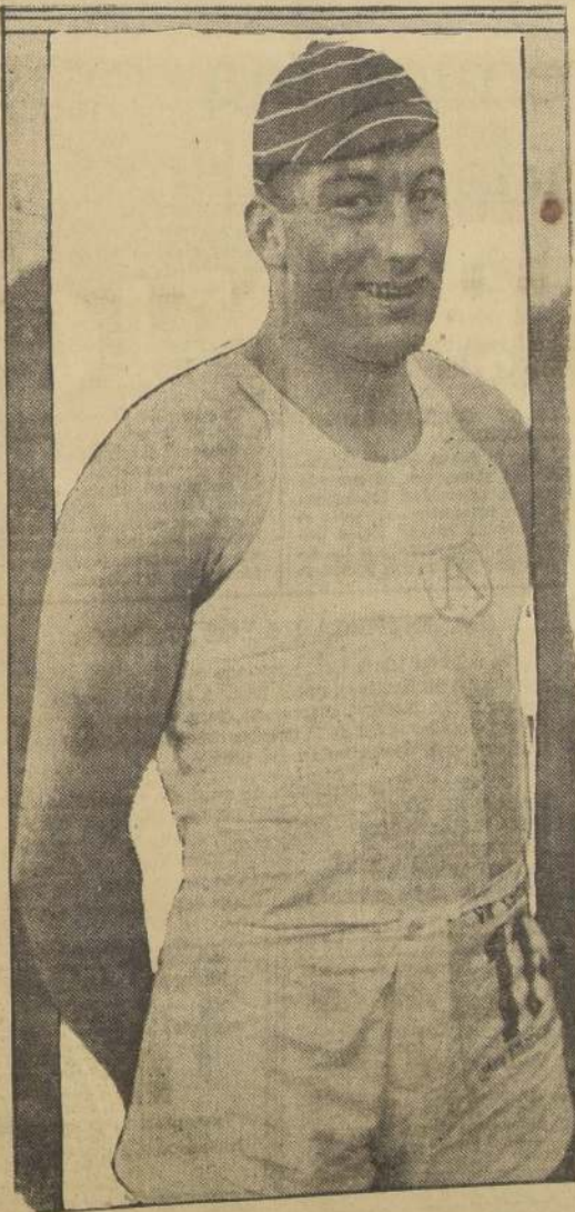
Héctor Berra, el argentino vencedor en el Decatlón.