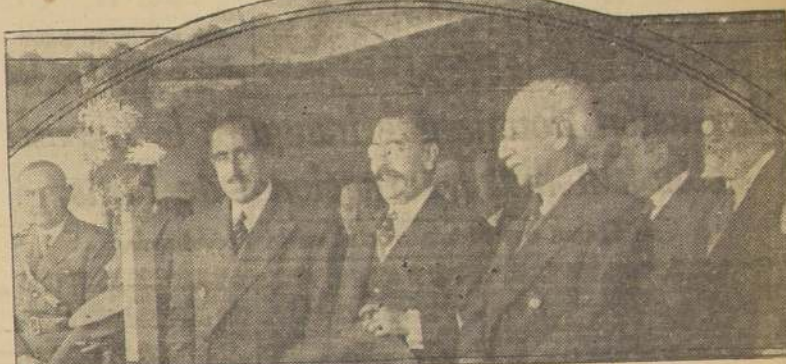
El Presidente de la República Argentina, general Urriburu, presencia el desarrollo de algunas pruebas del torneo, acompañado del Embajador de Chile, Excmo. señor Francisco Urrejola.

Faltan 600 metros para llegar a la meta en la prueba de 3,000 metros. Alarcón conserva todas