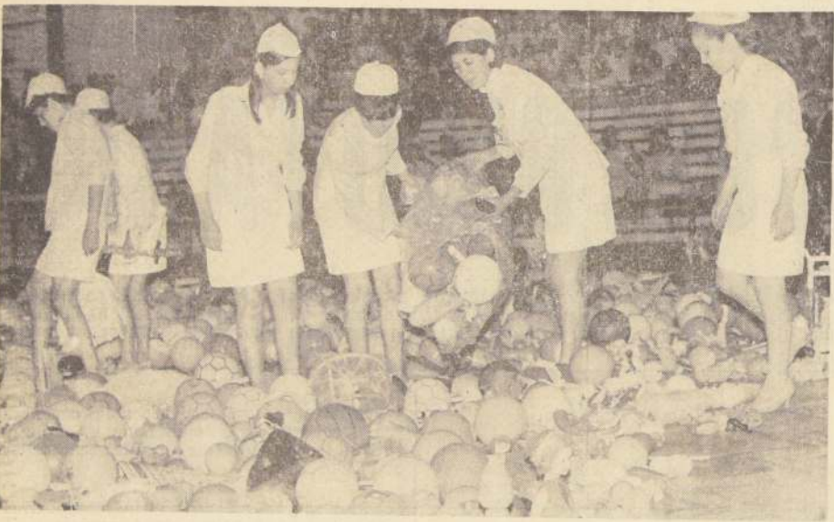
Numerosas admiradoras llevaron miles de juguetes al F Festival de Clausura de la Convención Nacional del Pollo Fuentes.