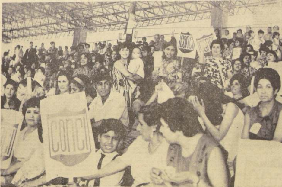
Un aspecto de la reunión de ayer que congregó a más de diez mil personas con motivo de la inauguración de un nuevo supermercado en el sector Hipódromo-Plaza Chacabuco, servicio instalado por CONCI. El público, durante este acto hizo objeto de una cálida demostración de afecto al Ministro del Interior, Edmundo Pérez Z., invitado de honor de esta fiesta popular.

En Chile las empresas de transporte son estatales.