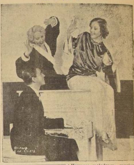
Hermoso melodrama musical que se estrena el martes en la Sala Imperio