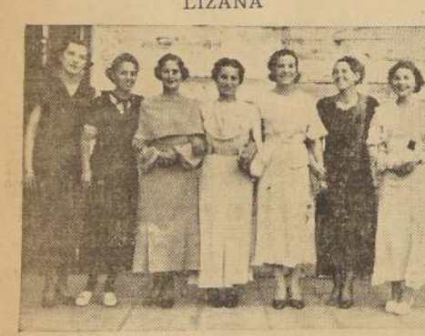
S. M. Elcira I, reina del barrio Yungay, rodeada de sus Damas de Honor, durante su visita de ayer a «LA NACION»

El jueves próximo se dará comienzo al programa de fiestas primaverales en el Barrio Yungay.