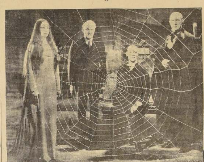
La más caprichosa de las películas. Una estrella que apenas puede verse y nunca puede tocarse o sentirse. La más veloz de las películas. En toda la historia del cine, se fotografió en los estudios de la Metro-Goldwyn-Mayer. El trabajo hubo de hacerse con infinito cuidado, delicadeza y tacto. No solamente los actores, sino todos los que tenían que hacer algo con la película, esta bajo su caprichoso dominio durante todo el tiempo que se tomó la película "El vampiro de Praga", misterioso drama de detectives, dirigido por Tod Browning.

Una película de misterio y terror que estrenará pronto el Teatro Santiago