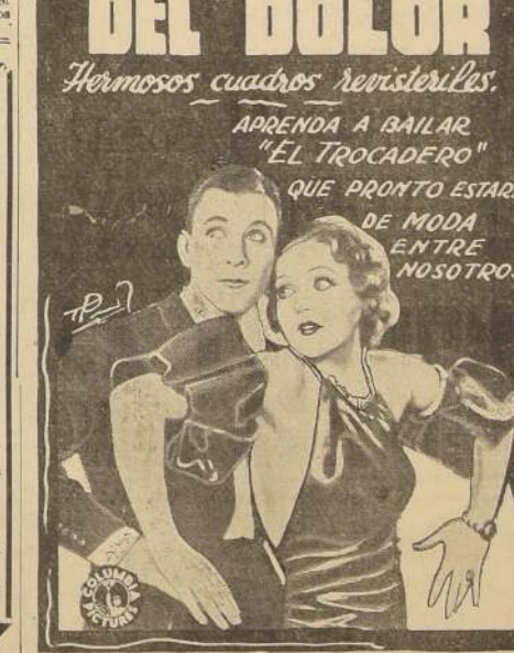
Hermoso melodrama musical que se estrena el martes en la Sala Imperio

Hermosos cuadros revisteriles. APRENDA A BAILAR "EL TROCADERO" QUE PRONTO ESTARA DE MODA ENTRE NOSOTROS