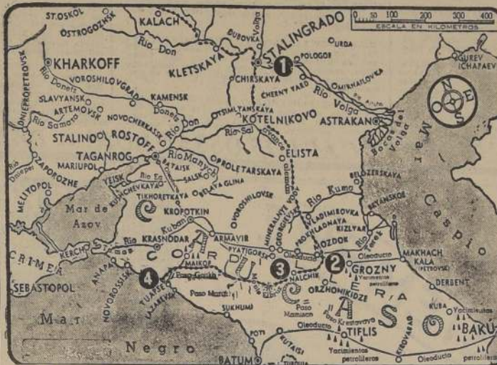
El N.º 1 señala la ubicación de la ciudad de Stalingrado, cuyo cerco rompieron totalmente las fuerzas rusas en su violenta y victoriosa ofensiva, que ha sido de desastrosas consecuencias para los nazis. El 2, 3 y 4 señala los principales sectores de batalla en el Cáucaso

NUEVA YORK, 25. (U. P.) — Al parecer, los alemanes se están retirando de la zona de Stalingrado, lo que constituye un hecho de gran importancia en esta guerra. Los alemanes han perdido a las tropas rumanas que se están rindiendo en masa. Los alemanes están retirando a las tropas rumanas que se están rindiendo en masa. Los alemanes están retirando a las tropas rumanas que se están rindiendo en masa.