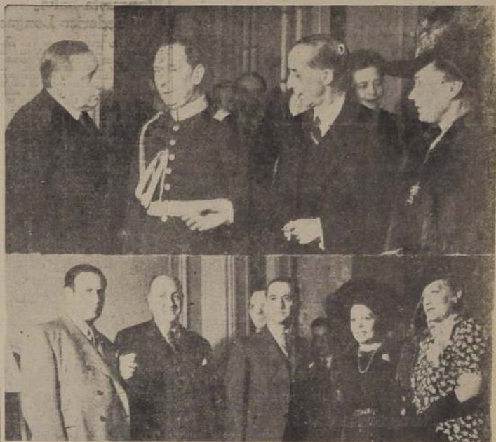
RECEPCION EN LA EMBAJADA DE EE. UU. El Embajador de Estados Unidos, señor Charles E. Bohlen, ofreció, en la tarde de ayer, en la sede de la Embajada, una recepción en honor del Rector y profesor de la Universidad de Chile y de los delegados extranjeros, a las fiestas conmemorativas del Centenario de la Universidad. A esta manifestación, que alcanzó especial brillo, asistieron, además, especialmente invitados, miembros del Cuerpo Diplomático, autoridades educacionales y distinguidas personalidades.

REGIAS ORQUESTAS - MICROS Y CARROS EN SERVICIO ESPECIAL