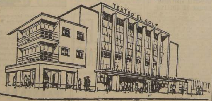
Aspecto exterior del futuro Teatro "El Golf"