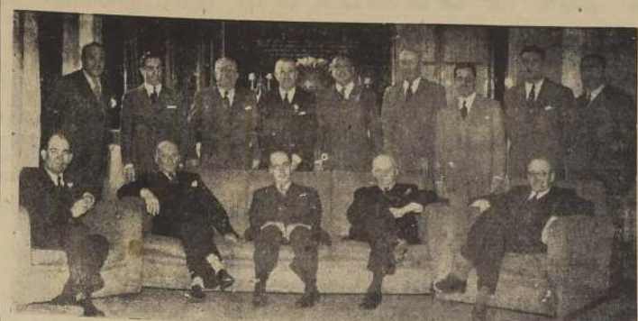
Asistentes al almuerzo con que se celebró el tercer aniversario de la constitución de la Sociedad Anónima Yaurur, manufacturera chilena de algodón