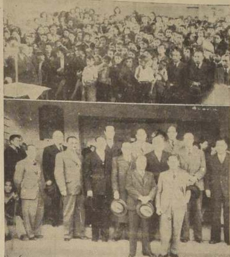
Durante el acto celebrado ayer en la Población "Lo Franco". Abajo, dirigentes del Rotary Club que concurrirán a la entrega de los premios.