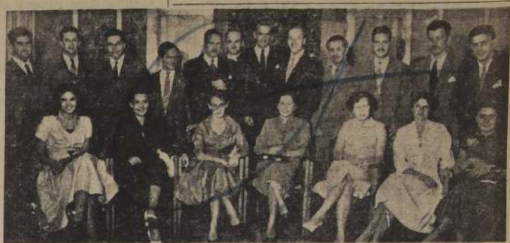
EN EL NURIA. — Asistentes a la comida en celebración del 5.º aniversario del Club "Tiburones".