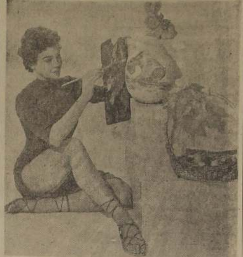
Leslie Caron también quiere demostrar sus aptitudes para la pintura en esta encantadora foto. La linda estrella francesa del ballet protagoniza junto a Gene Kelly la película, en technicolor, "Sinfonía de París".

En esta forma, tanto la Embajada de Francia en nuestro país, como la Cía. de Aviación Air France están estrechando los lazos que unen a artistas chilenos y franceses, en bien de las bellas artes.