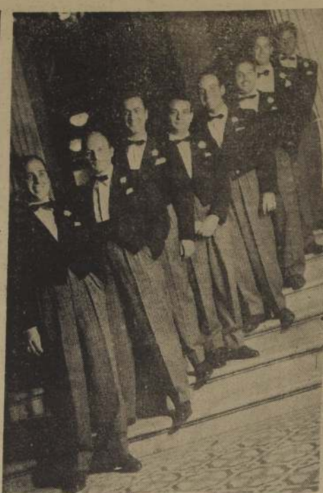
"LOS ESTUDIANTES" SE PRESENTARAN EN EL HOTEL CARRERA ANTES DE VIAJAR A EUROPA. — En las postimerías del presente, mas debutarán en el Hotel Carrera "Los Estudiantes", quienes vienen retornando de una triunfal gira que los sacó como una orquesta espectáculo sin parangón en América Latina. Esta será su última presentación, antes de embarcarse a Europa, con destino a España, iniciando una extensa gira que culminará en Egipto.

Continúa en el Teatro Central el éxito de "Rodolfo Valentino", la producción Columbia, filmada en Technicolor, y que presenta en