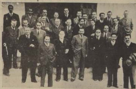
Asistentes al almuerzo ofrecido ayer a la prensa de Santiago por la Sociedad Nacional de Agricultura

A esta manifestación concurren representantes de todos