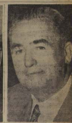
MARTIN P. DURKIN, Secretario del Trabajo