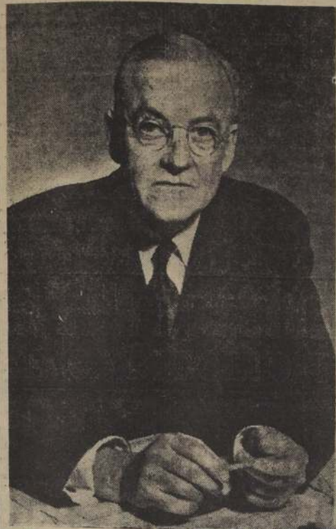
JOHN FOSTER DULLES, Secretario de Estado del Primer Gabinete del general Eisenhower que asume hoy la Presidencia de Estados Unidos.

WASHINGTON, 19. (UP). — El Presidente electo Eisenhower celebrará entrevistas con miembros de su nuevo Gobierno en el Hotel Statler, a las dos de la tarde. Esta mañana de la toma de posesión, pronto será uno de los días más activos del nuevo Presidente, que al mediodía de mañana se trasladará a la Casa Blanca con su esposa y la suite de ésta. Se espera que Eisenhower con sus familiares y los republicanos del Senado y la Cámara, y se reúnan con más de 30 parientes que han llegado a presenciar la toma de posesión. Según informes de la Casa Blanca, el nuevo Presidente no tiene hasta ahora propósitos de hacer la tradicional visita al Presidente saliente en víspera del traspaso de poderes. El Presidente electo, en compañía de su esposa, su hijo y su madre, así como de la madre de su esposa, llegará a Washington en un tren especial y se retirará a sus departamentos del hotel, pasando por delante de la estación sin pronunciar el discurso inaugural, y que aplaudieron al Presidente tan pronto lo vieron en la estación.