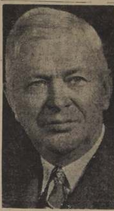
CHARLES ERWIN WILSON, Secretario de Defensa

BUEN TIEMPO La oficina meteorológica de Washington predijo hoy que se disfrutará de un día de primavera "un poco soleado" y que la temperatura fluctuará de 10 a 12 grados centígrados sobre cero. Contando, pues, con una temperatura ideal, los centenares de miles de personas que se espera presencien el magno desfile que partirá del Capitolio tan pronto termine Eisenhower de pronunciar su discurso. Miles de hombres de las fuerzas armadas, cañones automáticos y otras piezas de artillería, así como lujosas carrocerías, recorrerán las calles de la capital.