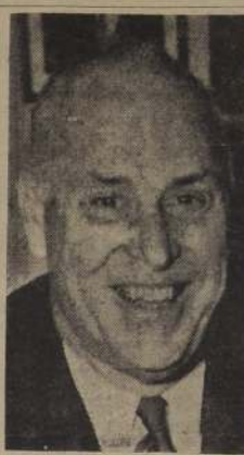
SINCLAIR WEEKS, Secretario de Comercio