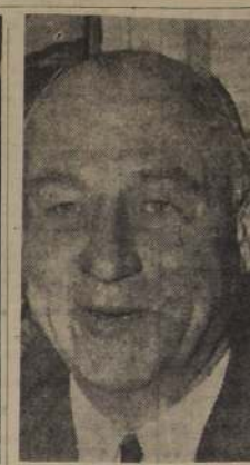
GEORGE M. HUMPHREY, Secretario del Tesoro